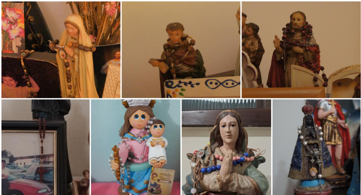
Figura 4: Montagem de objetos religiosos, 2023. São Paulo.