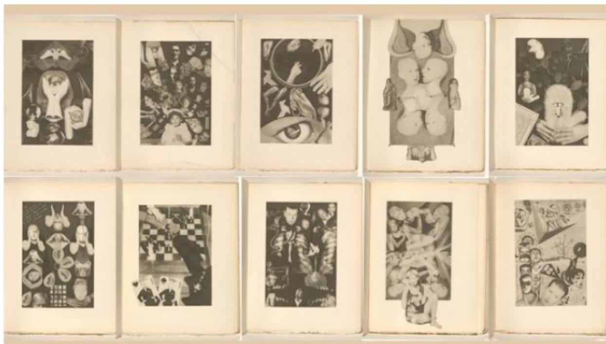
Figura 3: Claude Cahun, Conjunto de dez colagens parte do livro Aveux non avenues .