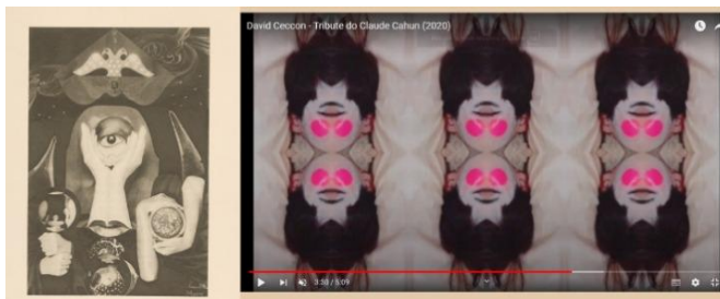
Figura 10: Frame da videoarte Tribute du Claude Cahun ao lado de uma colagem de Claude Cahun.

O terceiro momento inicia com os dizeres I AM TRAINNING! , e logo após vemos uma referência explícita à colagem colocada no início do vídeo [Figura 10]. O treinamento segue com a música anterior, porém com o ritmo mais rápido que acaba contagiando as imagens da tela que também começam a passar de maneira mais rápida. Algumas imagens que aparecem neste momento remetem à trabalhos realizados por Cahun, e ao final vemos novamente o peso de academia sendo levantado, e o que parece ser um alvo com dardos sendo jogados.