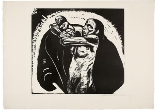
Figura 5: Kollwitz, O Sacrifício , 1922. Xilogravura, Käthe Kollwitz Museum, Köln.

Kollwitz consegue transmutar em imagem, a mistura de sentimentos e significados que a perda de um ente querido é capaz de provocar ao enlutado: