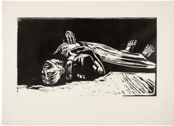
Figura 4: Kollwitz, A Viúva , 1922. Xilogravura, Käthe Kollwitz Museum, Köln.