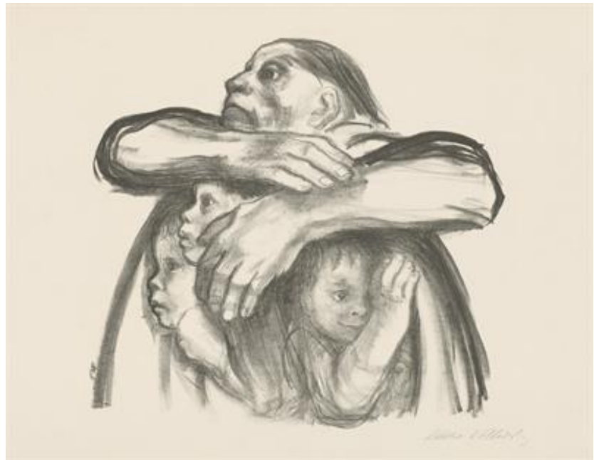
Figura 3: Kollwitz, Frutos verdes não devem ser colhidos , 1941. Litografia, Käthe Kollwitz Museum, Köln.

que as gravuras também são um testemunho pessoal da artista, ao analisarmos as principais gravuras da série, vislumbramos representações de diferentes mães que enfrentaram o vazio causado pela morte precoce de seus filhos num conflito armado.