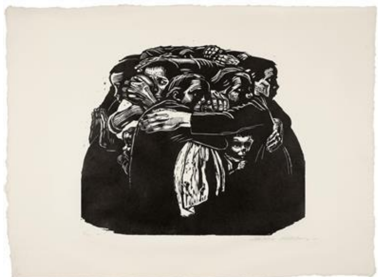
Figura 1: Kollwitz, As Mães, 1921-1922. Xilogravura, Käthe Kollwitz Museum, Köln.

Diante disso, iniciamos a análise propriamente dita da série Guerra a partir da xilogravura As mães [Figura 1] em que Käthe esboça a preparação para o que viria a ser uma escultura. Ao falar sobre a obra em um de seus diários, a artista diz que as mães estão “protegendo ferozmente suas crianças, como animais protegem seus filhotes” 8 . Da mesma forma, na imagem, observamos as mães formando um círculo em volta dos filhos pequenos, no intuito de protegê-los. As mulheres entrelaçam suas mãos e braços de uma forma que se mostra impenetrável, com os olhos atentos e em busca de possíveis perigos. Não seria exagero afirmar que a figura materna nas obras da artista é colocada de forma “selvagem” no sentido de proteção da vida.