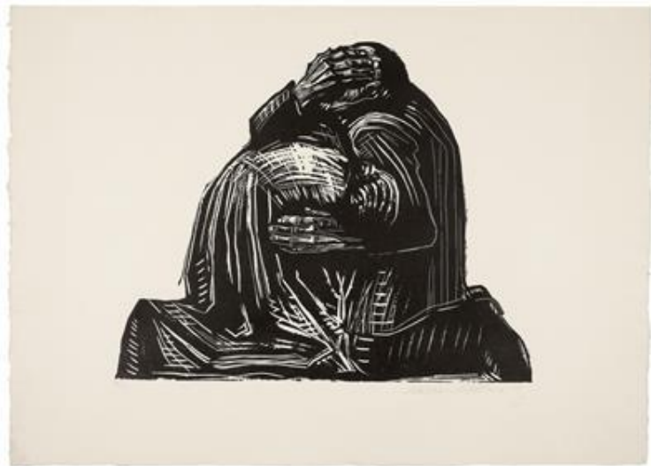
Figura 2: Kollwitz, Os Pais, 1921-1922. Xilogravura, Käthe Kollwitz Museum, Köln.

Outro ponto importante, é que talvez essa “época de decadência” a qual ela se refere fosse sobre o fato dos artistas daquele contexto estarem rompendo com os padrões estéticos supervalorizados a tanto tempo. A Die Brücke , por exemplo, se mostrou firme em romper com a academia. Um dos motivos para Kollwitz acreditar que talvez não fosse tão simples aderir a esse movimento, fosse por sua materialidade já concebida nas artes gráficas, e a aceitação por parte do público a esse tipo de produção. O fato de ser uma mulher artista em uma época como aquela, como já contextualizado no início deste artigo, e com sua idade chegando aos 70 anos, seria arriscado romper com sua própria produção.