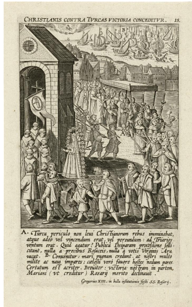
Figura 5: Theodoor Galle. Milagre da Batalha de Lepanto , 1610. Ilustração da série Quinze milagres do rosário.

Convocada pelo papa dominicano Pio V, o sucesso desta batalha sagrada foi creditado à Virgem do Rosário e o culto foi definitivamente legitimado pela Igreja, com a instituição da Festa de Nossa Senhora da Vitória e a posterior instituição da Festa de Nossa Senhora do Rosário. 25