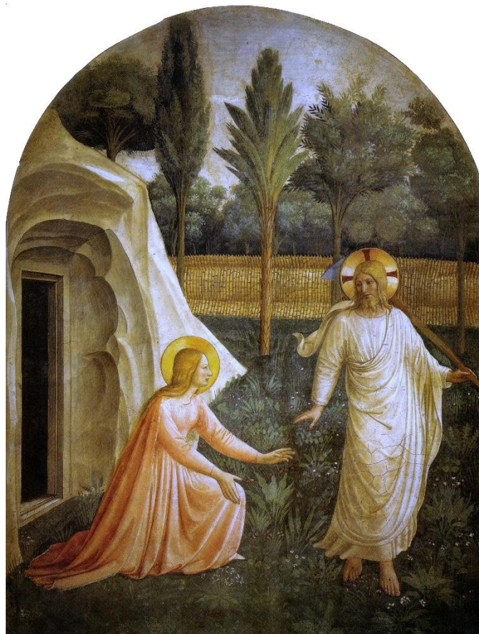
Figura 3: Fra Angélico. Noli me tangere , 1439-1443. Pintura afresco. Convento de São Marcos, Florença.

Nos séculos XI e XII, coletâneas de orações em honra à Virgem Maria foram escritas sob o título de Jardim de Rosas . Estes textos orientavam a vida dos monges, que associavam a prática da jardinagem e o trabalho do jardineiro à vida dos cristãos: cultivar jardins de flores tornou-se uma forma de oração e meditação sobre a vida de Jesus e Maria. As colheitas desses jardins representavam a reconquista do Paraíso e da Liberdade. Foram os monges ascetas do deserto os primeiros a compreenderem a importância simbólica de um jardim, estabelecendo um paralelo entre o seu cultivo e a vida de oração. Nesta perspectiva, a doutrina cristã é bem clara: a oração e o sacrifício sempre precedem a salvação 15 . Na História da Arte, há muitas representações de Cristo como jardineiro. Contudo, o afresco Noli me tangere , pintado no Convento de São Marcos, em Florença, por Fra Angélico, é especialmente emblemático, pois foi concebido com o propósito de estimular a meditação dos monges que viviam no mosteiro [Figura 3]. O pintor representou Cristo ressurreto no interior de um Jardim Trancado, cercado por uma treliça de bambu e repleto de árvores e flores. Cristo segura uma pá na mão, simbolizando a conclusão de seu trabalho: a remissão do pecado original e a sua Ascensão aos céus.