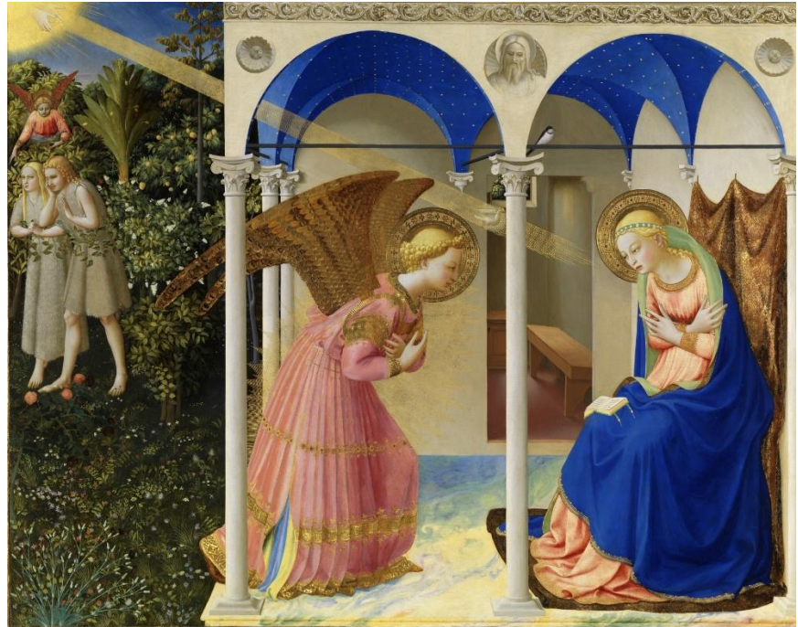
Figura 1: Fra Angélico. Anunciação , c. 1426. Têmpera sobre madeira. Dimensão: 194 x 194 cm. Museu do Prado, Madri.

Nos jardins imaginários, pintados por artistas europeus do final da Idade Média, desabrocham flores e frutos diversos: violetas, lírios dos vales e íris, rosas e margaridas; romãs, maçãs e morangos. Cerejeiras e videiras repletas de frutos exalam os mais variados e doces aromas. Canteiros de bálsamos e perfumes de ervas aromáticas, como nardo e açafrão, canela e cinamomo, mirra e aloés. Cravos e rosas vermelhos lembram o sacrifício do menino Deus. Coroas e grinaldas de rosas são tecidas como símbolos do recinto fechado (o Jardim Trancado) e da alegria celestial (o Paraíso). Panos de honra são delicadamente bordados com motivos vegetais e florais.