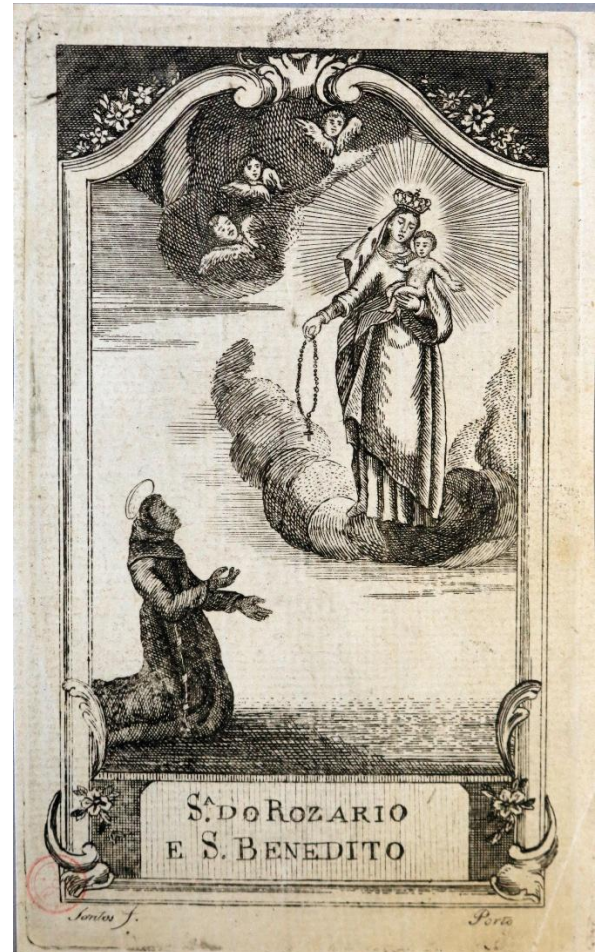
Figura 7: Autor desconhecido. Nossa Senhora do Rosário e São Benedito , s/data. Registro de Santo. Biblioteca Nacional de Portugal (BNP).