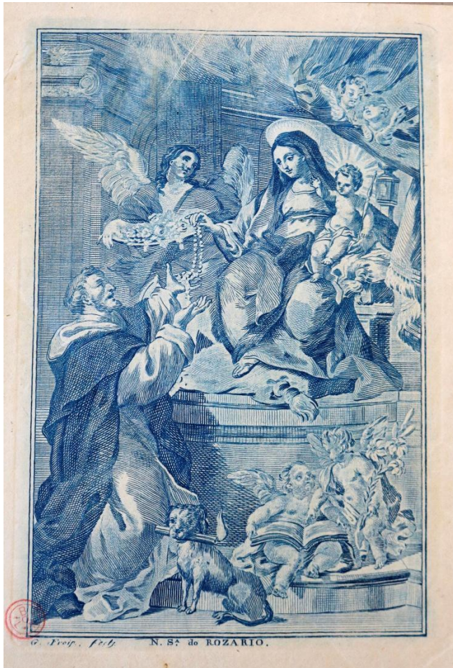
Figura 6: Autor desconhecido. Nossa Senhora do Rosário , séc. XVIII. Registro de Santo. Biblioteca Nacional de Portugal (BNP).

iconográfico da Virgem do Rosário também foram amplamente difundidos por meio dos Registros de Santos [Figura 9]. Grande parte dessas estampas apresenta a Virgem e o Menino entregando o rosário para São Domingos de Gusmão e Santa Catarina de Siena, mas a circulação pelos territórios conquistados desencadeou uma série de apropriações e reinterpretções.