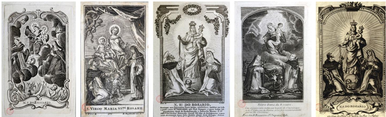
Figura 9: Autores desconhecidos. Nossa Senhora do Rosário , séc. XVIII-XIX. Registros de Santos. Biblioteca Nacional de Portugal (BNP).

Na região mineradora e diamantífera, a maioria das congregações formadas pelas comunidades africanas construiu templos próprios, que se tornaram uma espécie de território demarcado, ainda que esses espaços fossem mistos e compartilhados com pessoas de todas as “qualidades e condições” 36 . Nesses ambientes plurais, os irmãos pretos do Rosário costumavam assumir os principais cargos da mesa administrativa e se responsabilizavam pela promoção do culto. Eles organizavam os ofícios litúrgicos e