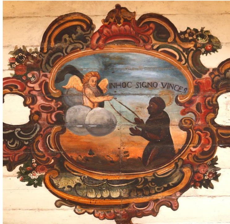
Figura 8: Autor desconhecido. São Benedito , séc. XVIII-XIX. Pintura de ferro do nártex. Igreja de Nossa Senhora do Rosário dos Homens Pretos. Ouro Preto, Minas Gerais.