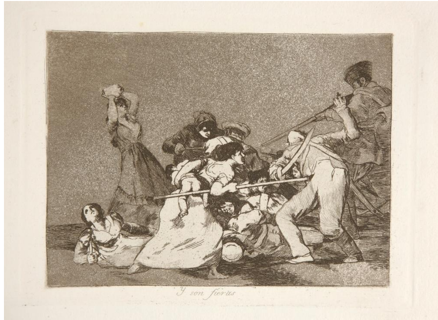
Figura 1: Francisco de GOYA y Lucientes. Y son fieras , Desastres de la guerra [estampa 5], 1810 -1814. Gravura, 158 x 210 mm. Museo Nacional del Prado, Madrid.