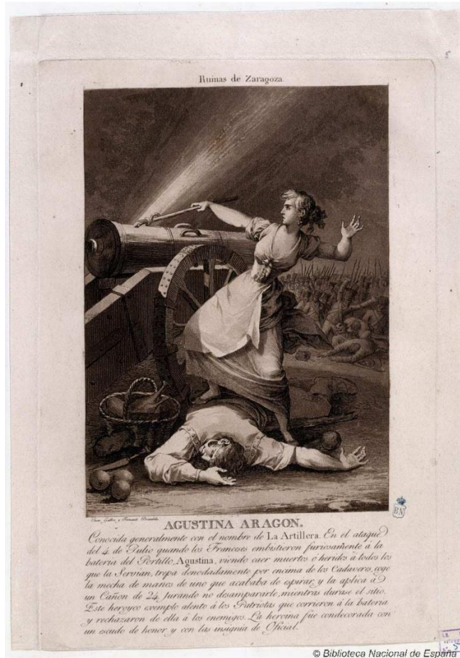
Figura 06: Juan GÁLVEZ. Agustina de Aragón. Cádiz, 1812-1813. Gravura, prova de estado, 475 x 375 mm. Museo Lázaro Galdiano, Madrid.

Transcrição da legenda: “AGUSTINA ARAGON. Conocida generalmente con el nombre de La Artillera. En el ataque del 4 de Julio quando los Franceses embistieron furiosamente á la bateria del Portillo, Agustina, viendo caer muertos ó heridos á todos los que la Servian, trepa denodadamente por encima de los cadaveres, coge la mecha de manos de uno que acababa de espirar, y la aplica á un Cañon de 24. Jurando no desampararle, mientras durase el sitio. Este heroyco exemplo alento á los Patriotas que corrieron á la bateria y rechazaron de ella á los enemigos. La heroína fue condecorada con un escudo de honor y con las insignia de Oficial.”