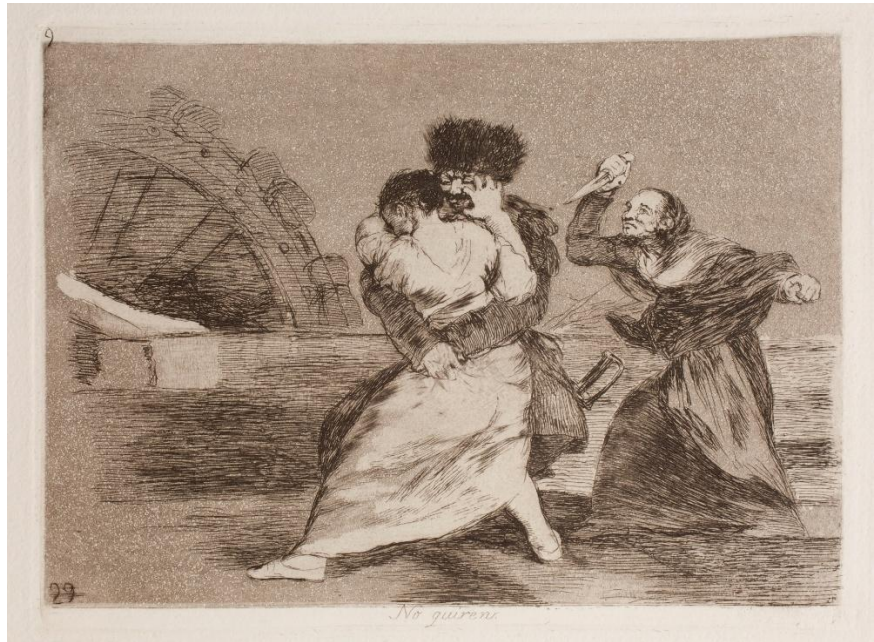
Figura 9: Francisco José de GOYA y Lucientes. No quieren. Desastres de la guerra [estampa 9], 1810-1814. Gravura, 156 x 209 mm. Museo Nacional del Prado, Madrid.

por meio do texto descreve as disposições internas, as vontades e desejos das figuras femininas. Para o autor, a repetida ênfase do pintor aragonês na experiência subjetiva das vítimas marca uma viragem moderna nas representações ocidentais, em que vítimas cotidianas emergem como novas protagonistas da narrativa visual. 20