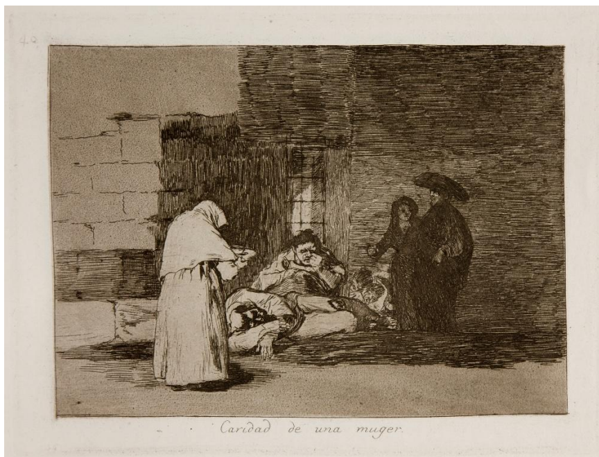
Figura 8: Francisco José de GOYA y Lucientes. Caridad de una muger. Desastres de la guerra [estampa 49], 1812-1814. Gravura, 156 x 208 mm. Museo Nacional del Prado, Madrid.