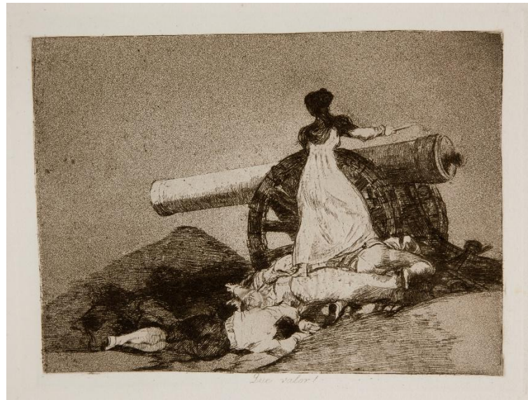
Figura 3: Francisco José de GOYA y Lucientes. Que valor! Desastres de la guerra [estampa 7], 1810-1814. Gravura, 158mm x 209mm. Museo Nacional del Prado, Madrid.

universal da cena. Já na segunda composição, ao contrário, Agustina é identificada pelo nome e a gravura inclui referências ao local da batalha, à data e uma descrição que a apresenta como “ la intrepida ”, “ haciendo fuego con gallarda bizarria ”.