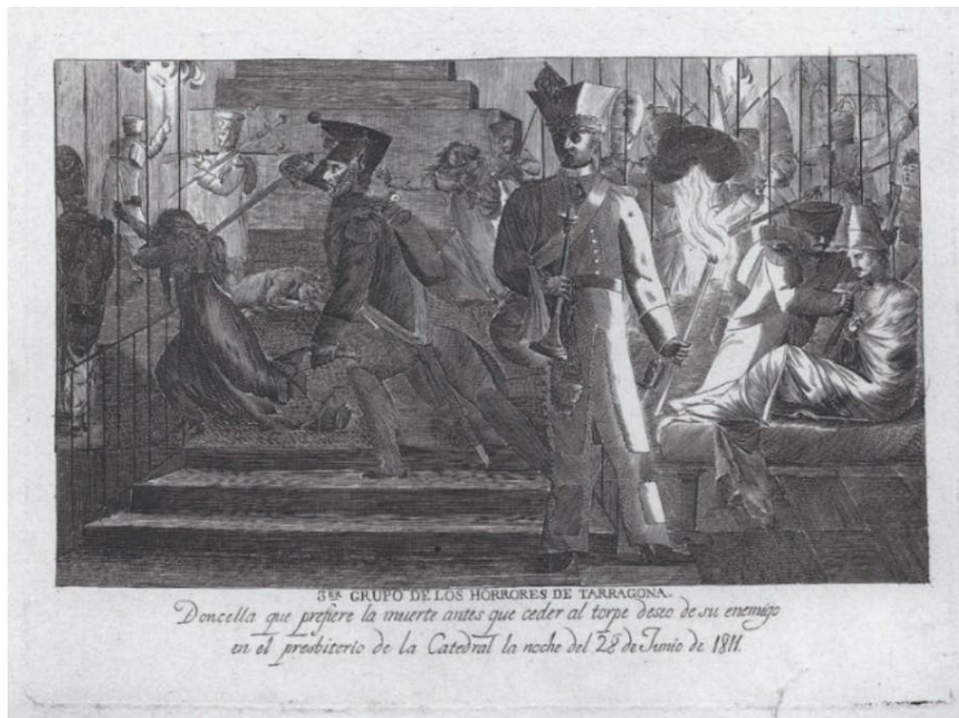
Figura 10: ANÔNIMO. Tercer grupo de los horrores de Tarragona: Doncella que prefiere la muerte, 1811. Butil, 220 x 320 mm. Colección Antonio Correa, Real Academia de Bellas Artes de San Fernando, Madrid.

Ao observar a estampa Tercer grupo de los horrores de Tarragona [Figura 10], percebe-se o tamanho desproporcional dos soldados e sitiantes em relação às vítimas, evidenciando seu poder bélico. À frente da gravura, destaca-se uma figura masculina segurando, em uma das mãos, uma corneta e, na outra, uma tocha. Chama atenção o lado esquerdo, onde uma jovem, encurralada, tem as costas atingidas pela espada empunhada por um soldado. A inscrição abaixo explica: “Doncella que prefiere la muerte antes que ceder al torpe deseo de su enemigo en el presbiterio de la Catedral la noche del 28 de Junio de 1811”. Diferente dos Desastres , a estampa anônima oferece uma inscrição e constrói uma ambientação mais detalhada. Por outro lado, ambas são fortes construções visuais dos horrores da guerra.