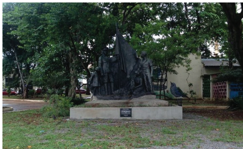
[Figura 9] escultura “Pátria e Família”, localizada na praça José Moreno.

Frame do vídeo Memória da Amnésia, elaborado como documentação da exposição Memória da Amnésia. Direção e imagem por Cleisson Vidal, projeto de Giselle Beiguelman. O vídeo está disponível em: < https://vimeo.com/161144900 >, acesso em dez. 2019.