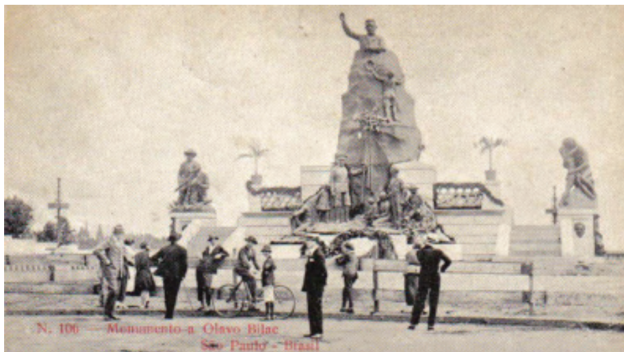
[Figura 1] Postal do Monumento a Olavo Bilac, no belvedere da Avenida Paulista (altura da Rua Minas Gerais), em 1922.

Fonte: TOLEDO, Benedito Lima de. Álbum Iconográfico da Avenida Paulista . São Paulo: Ex Libris, 1987, p. 25. Crédito da fotografia: João Baptista Monteiro da Silva.