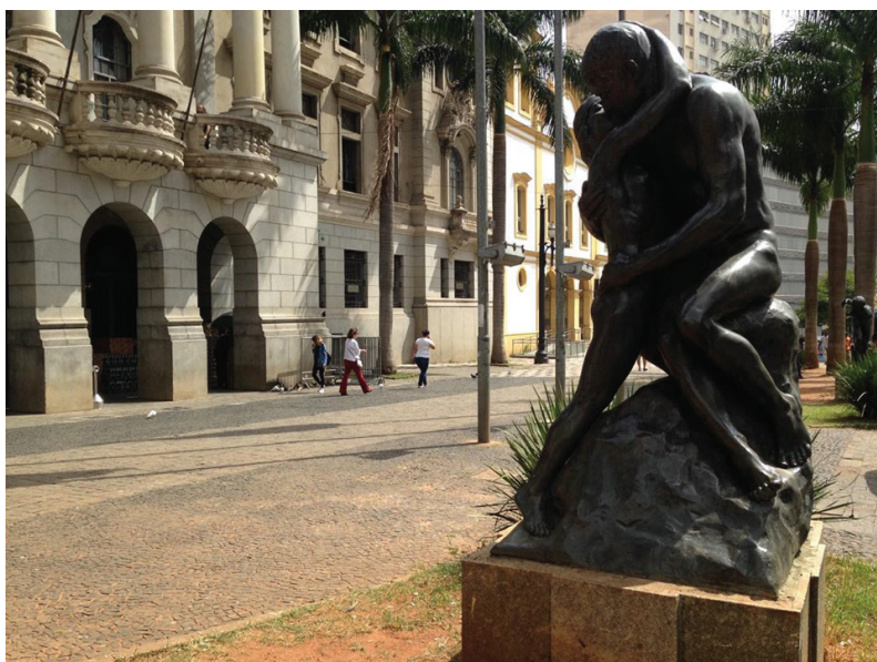
[Figura 10] escultura “Beijo Eterno” ou “idílio”, localizada no Largo São Francisco.