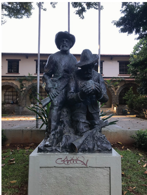
[Figura 7] escultura “O Caçador de Esmeraldas”, localizada na Escola Estadual Fernão Dias.