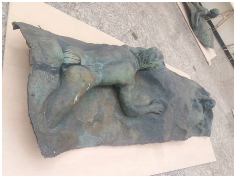
[Figuras 2 e 3] fragmentos “Pátria” e “Via Láctea”, respectivamente, na exposição Memória da Amnésia.