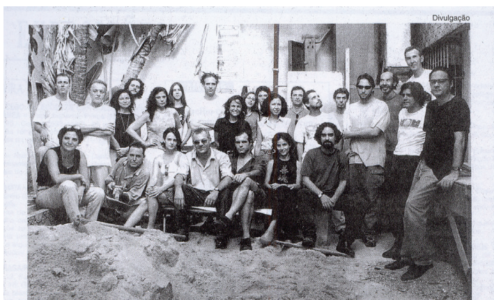
Quarenta artistas abrem hoje a coletiva Orlândia: espírito mambembe como rebeldia