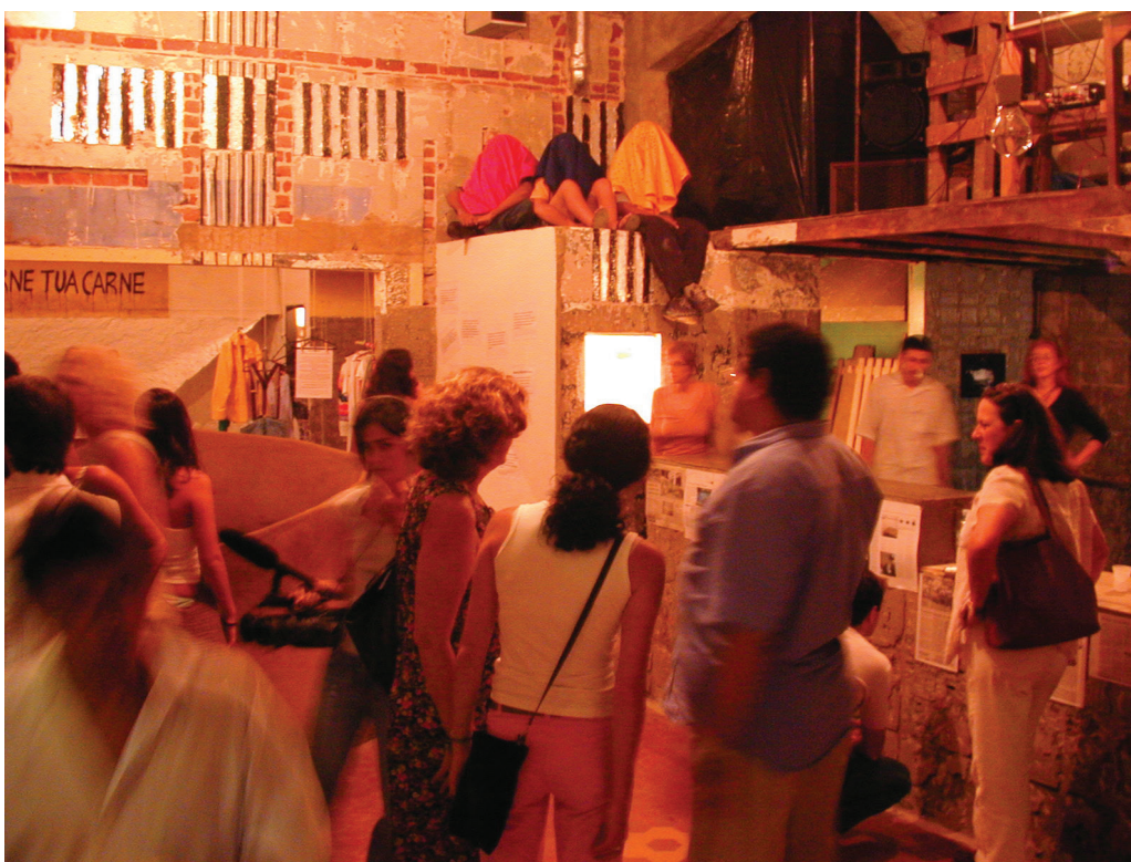
[Figura 05] Vista interna de uma das lojas de São Cristóvão. Grande Orlândia, 2003.