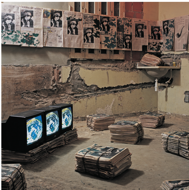
[Figura 01] Anna Bella Geiger, Rrose Sélavy, mesmo , 1995-1997, videoinstalação.