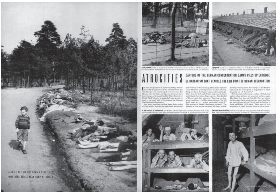
[Figura 01] George Rodger; Margaret Bourke-White. Life magazine, May 7, 1945.

Disponível em: < https://time.com/3638432/behind-the-picture-the-liberation-of-buchenwald-april-1945/ > Acesso em: 20 dez. 2019.