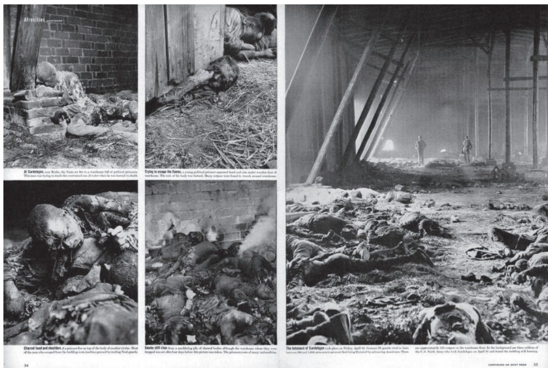
[Figura 02] William Vandivert. May 7, 1945.

Disponível em: < https://time.com/3638432/behind-the-picture-the-liberation-of-buchenwald-april-1945/ > Acesso em: 20 dez. 2019.