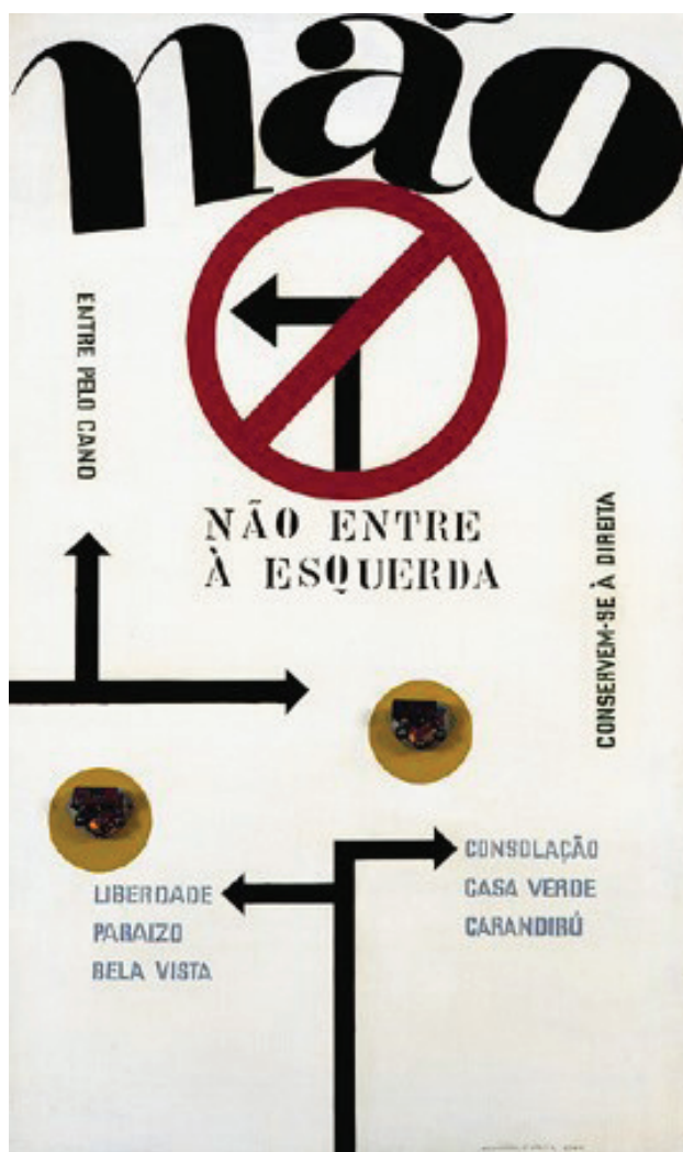
[Figura 01] Maurício Nogueira Lima (Recife, 1930 – Campinas, 1999), Não entre à esquerda , 1964.

Metal e esmalte sintético sobre aglomerado, 99,2 x 59,6 cm. Acervo do Museu de Arte Moderna de São Paulo – MAM SP