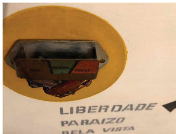
[Figuras 03 e 04] detalhes “Não entre à esquerda”, 1964