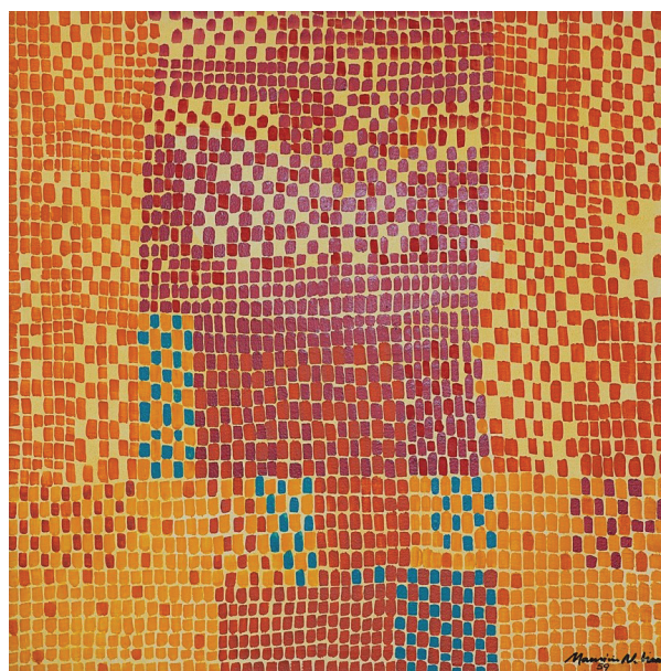
[Figura 02] Maurício Nogueira Lima (Recife, 1930 – Campinas, 1999), Reticula , 1959.

Metal e esmalte sintético sobre aglomerado, 99,2 x 59,6 cm. Acervo do Museu de Arte Moderna de São Paulo – MAM SP