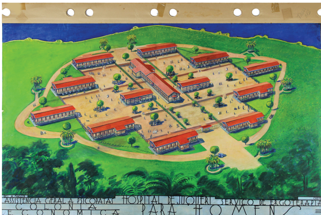
[Figura 01] Antonio Magon. Sem título. 1938.

Guache, nanquim, heliografia e grafite sobre papel. 52 x 77,5 cm.