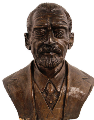
[Figura 08] Autoria desconhecida. Busto de Dr. Francisco Franco da Rocha . Sem data.

Molde de cerâmica perdida. 19,5 x 13 x 15,5 cm.