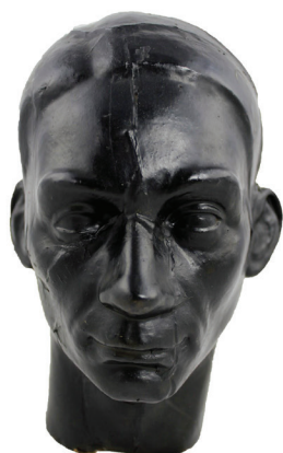
[Figura 07] Tarsila do Amaral. Osório Thaumaturgo Cesar . Sem data.

Óleo sobre papel. 50 x 40 cm.