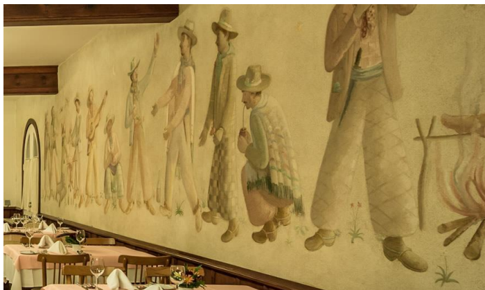
Figura 4: Fulvio Pennacchi, Mural para Hotel Toriba. Campos do Jordão/ SP, c.1943. Domínio público.