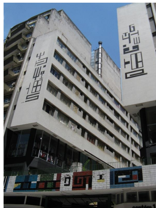
Figura 7: Bramante Buffoni, sem título , c.1962, mosaico de cerâmica esmaltada sobre parede. Edifício Galeria Nova Barão, centro, arq.: Ermano Siffredi e Maria Bardelli.