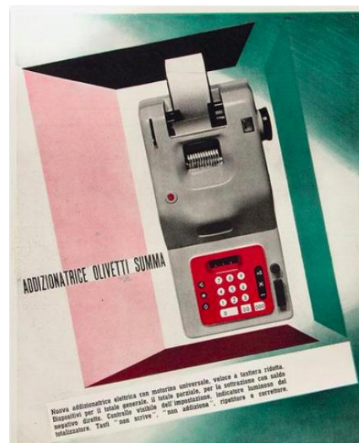
Figura 5: Bramante Buffoni, Olivetti Summa, 1942. Domínio público.