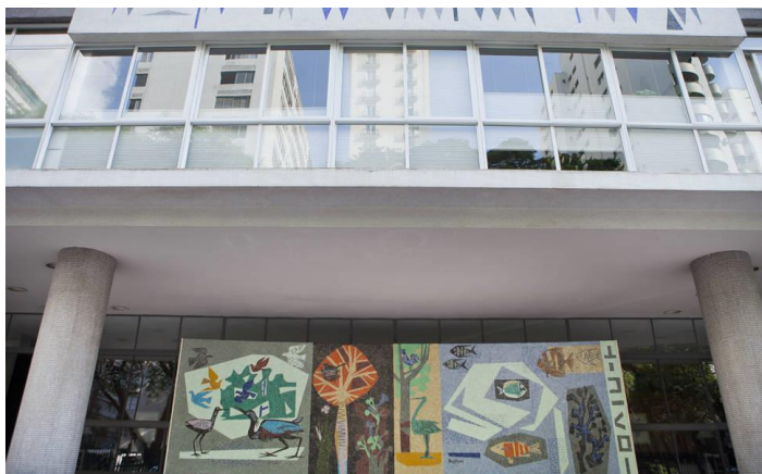
Figura 6: Bramante Buffoni, sem título , c.1957, mosaico de pastilha sobre parede. Ed. Nobel Higienópolis, arq.: Ermano Siffredi e Maria Bardelli.