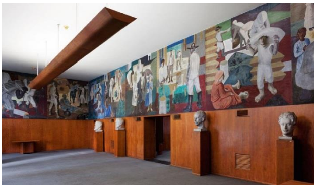
Figura 8: Cândido Portinari, Ciclo da vida econômica do Brasil , 1936-1944, Ministério da Educação e Saúde, Rio de Janeiro, RJ, Brasil, domínio público.