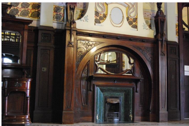
Figura 1: Vila Penteado, desenho arquitetônico de Carlos Eckman, 1902. São Paulo, SP, domínio público.