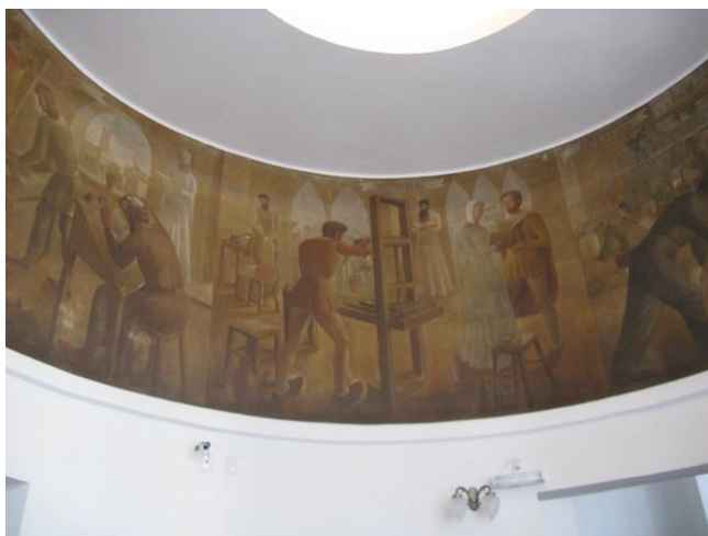
Figura 3: Fulvio Pennacchi, História da Imprensa , 1939. Óleo sobre parede, 250 x 1200cm. Antiga sede do jornal "A Gazeta", projeto de Severo e Villares.