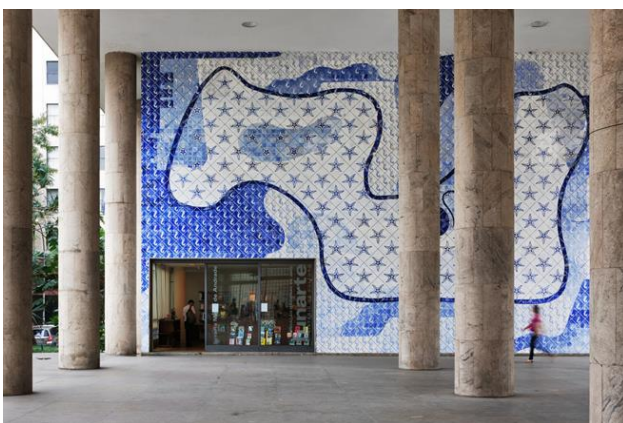
Figura 10: Cândido Portinari, mural para o Ministério da Educação e Saúde, azulejo, 1938-1944. Arquitetos: Lucio Costa, Oscar Niemeyer, Rio de Janeiro, RJ. Domínio público.