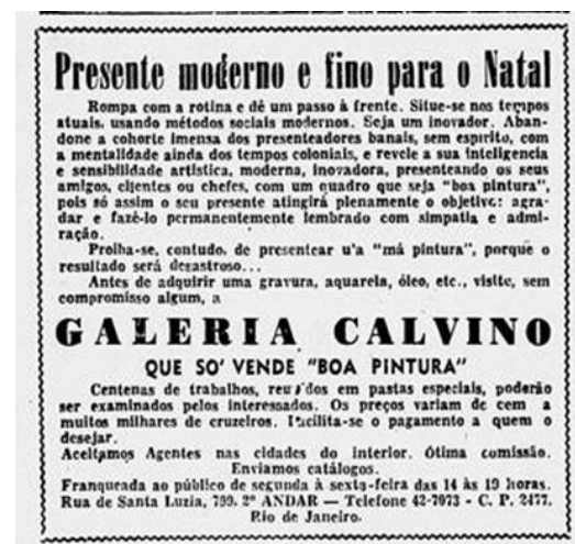
Figura 5: Presente moderno e fino para o Natal. Jornal Diário da Noite, 2 dez. 1948, p. 7.