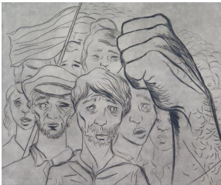
Figura 2: Fernando P., Sem título (Manifestação) , 1949. Gravura água-forte para distribuição aos sócios do Clube dos Glifófilos. Dimensão: 22,3 cm x 27,6 cm. Coleção Eduardo Ribas, Curitiba, PR.

O Clube dos Glifófilos foi fundado por José Calvino Filho, membro do Partido Comunista Brasileiro, organização que deu expressivo apoio à criação de outros clubes de gravura – Clube da Gravura de Porto Alegre e Clube da Gravura de Bagé, entre outros – que ajudariam as finanças do partido, através da arrecadação de parte do dinheiro obtido com a venda destas obras. Os Glifófilos estão inseridos num período muito particular de nossa história da arte, pois mesmo diante da chegada do abstracionismo, o modernismo tardio e a arte figurativa ainda se faziam presentes. Sua presidência era ocupada por Candido Portinari (1903-1962) e a vice-presidência por Carlos Oswald (1882-1971), precursor do ensino da gravura artística no Brasil. Os artistas que participaram desta agremiação se dividiam em dois grupos: aqueles filiados ao Partido Comunista e comprometidos com uma linguagem plástica moderna sem abrir mão da figuração – Candido Portinari, Poty Lazzarotto (1924-1998), Tomás Santa Rosa (1909-1956), Fernando P. (1917-2005) e Eugênio Proença Sigaud (1899-1979) – e os pintores gravadores comprometidos com a linguagem figurativa da tradição, liderados por Carlos Oswald, Carlos Geyer, Hans Steiner (1910-1974) e Edgard Cognat (1919-1994).