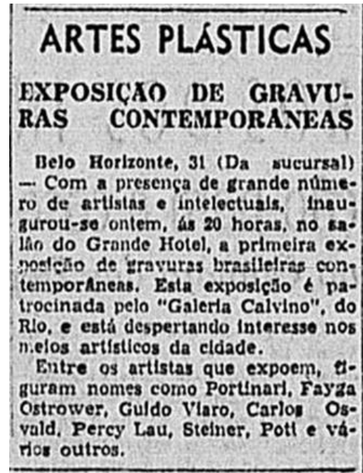
Figura 4: Exposição em Belo Horizonte de gravuras contemporâneas. Correio da Manhã, 1 set. 1949. Disponível em: http://memoria.bn.br/DocReader/089842_05/49117 . Acesso em: 31 jan. 2022.