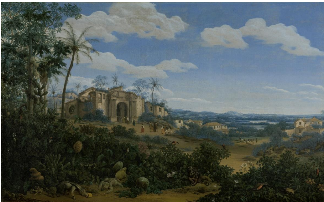
Figura 4: Frans Post, Vista da Sé de Olinda , 1662. Óleo sobre tela, 107,5 x 172,5 cm, Rijksmuseum, Amsterdã.