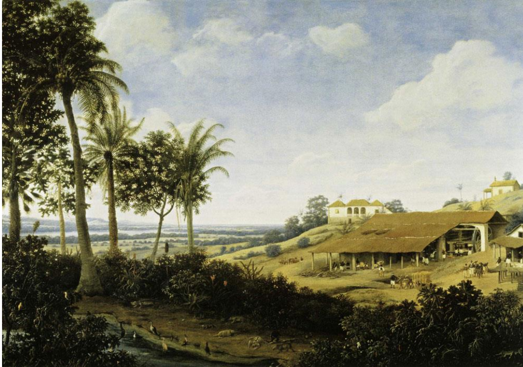
Figura 3: Frans Post, Engenho , c. 1660. Óleo sobre painel, 69,8 x 106 cm, Coleção particular, Long Island.