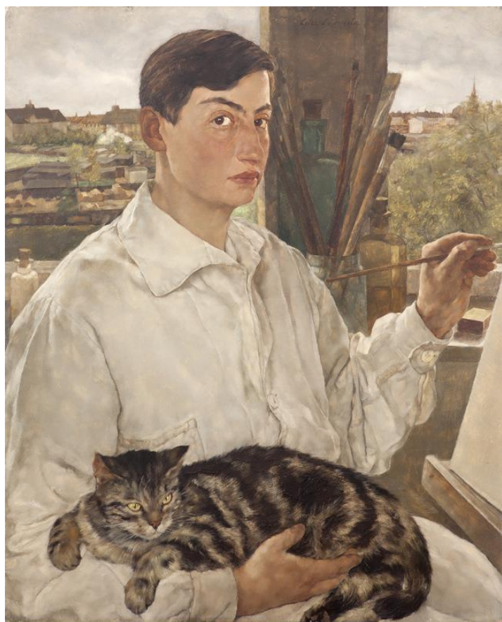
Figura 7: Lotte Laserstein, Self-Portrait with cat , 1928.