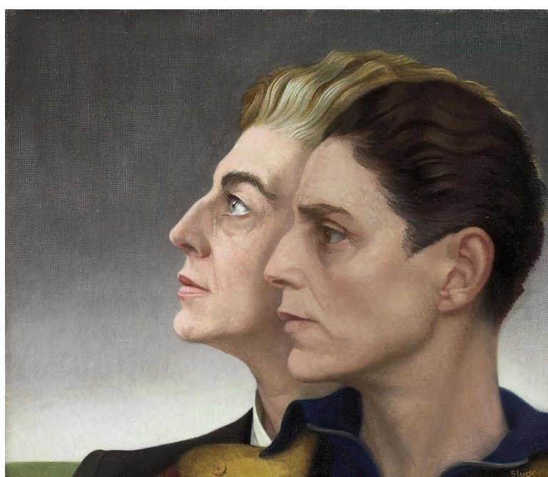
Figura 5: Gluck, Medallion , 1936. Óleo sobre tela, 30,5cm X 35,6cm, Coleção particular.