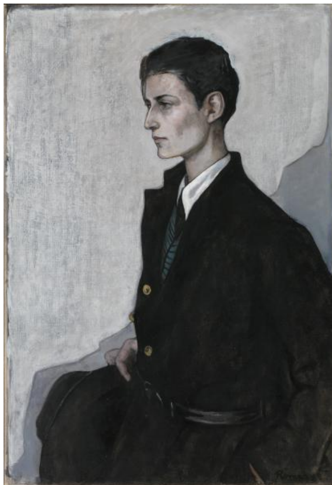
Figura 4: Romaine Brooks, Peter (A Young English Girl) , 1923-1924. Óleo sobre tela, 91,9cm X 62,3cm, Smithsonian American Art Museum.