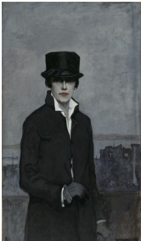
Figura 3: Romaine Brooks, Self-Portrait , 1923. Óleo sobre tela, 117,5cm X 68,3 cm, Smithsonian American Art Museum.