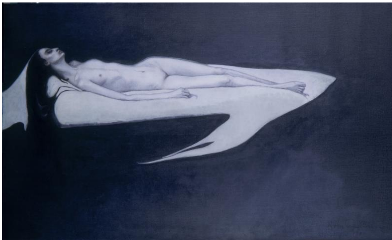
Figura 2: Romaine Brooks, Le trajet , 1911. Óleo sobre tela, 115.2cm X 191.4 cm, Smithsonian American Art Museum. .