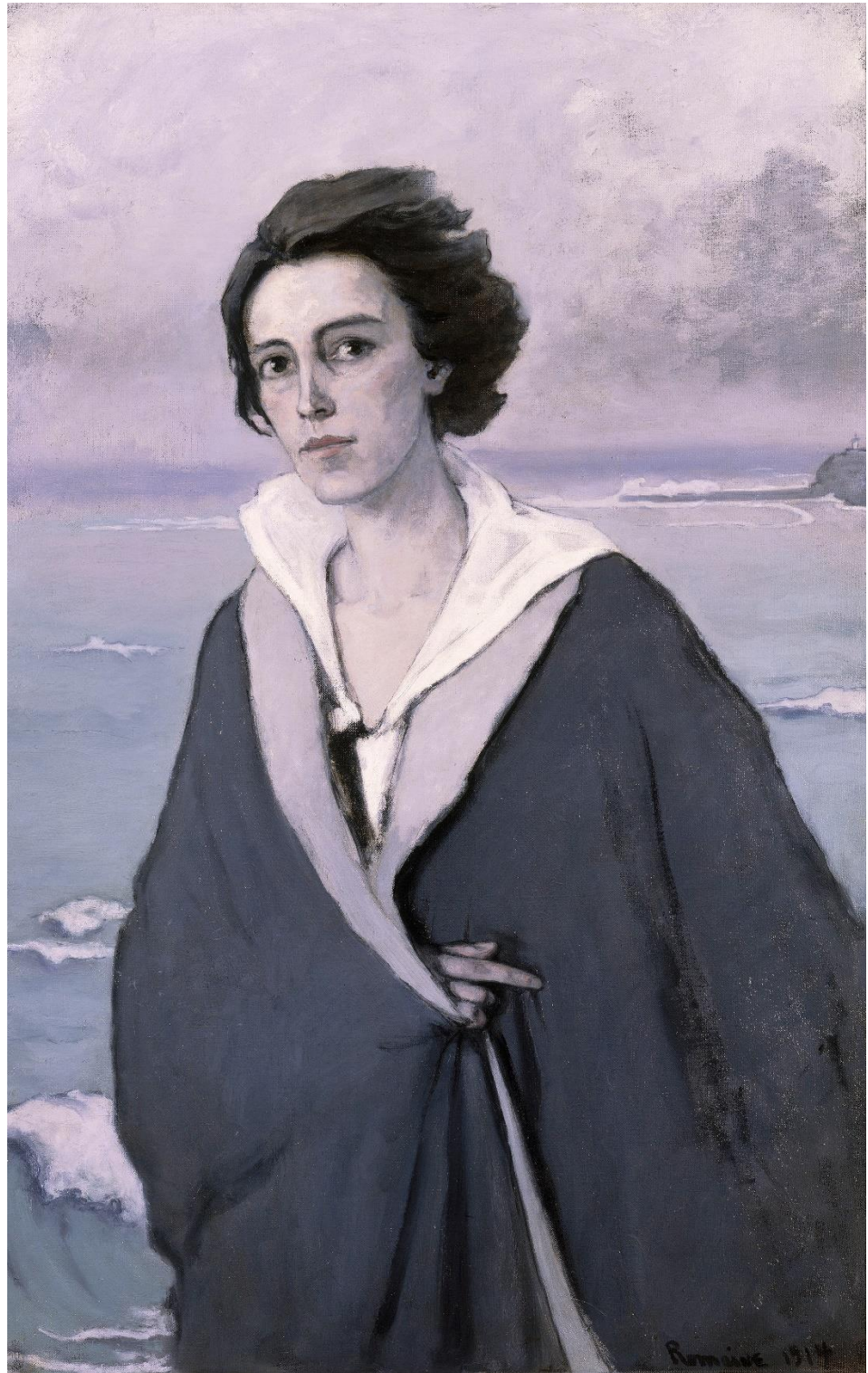
Figura 1: Romaine Brooks, At the Edge of the Sea , 1914. Fonte: LANGER, Cassandra. Romaine Brooks. A Life. Wisconsin: The University of Wisconsin Press, 2015.