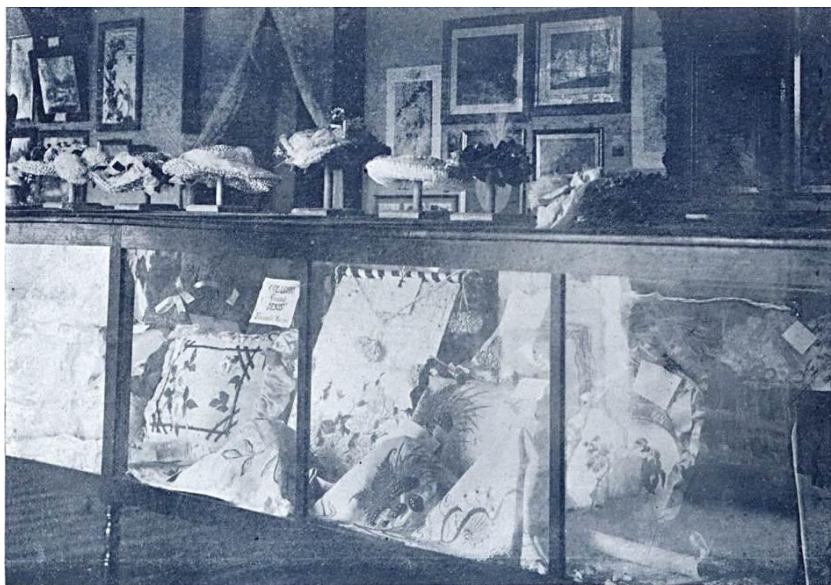
Figura 4: Produções de arte feminina, designada de “outras artes” na Exposição Agrícola de Santa Catarina.