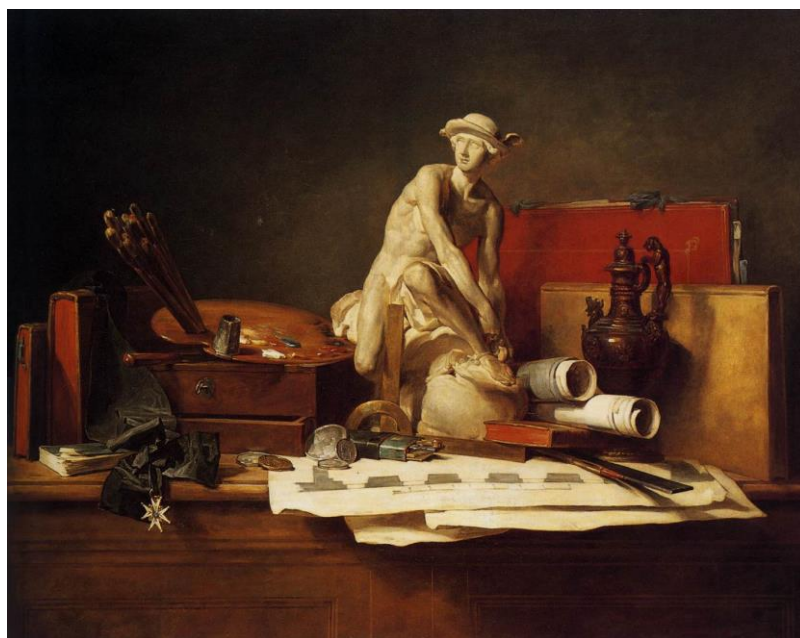
Figura 1: Jean-Baptiste-Siméon Chardin, The Attributes of Art , 1766. Oil on canvas, 113 x 145 cm. Institute of Arts, Minneapolis.

Tanto a definição quanto a ação e recepção do decorativo passaram por negociações controversas e instáveis entre os séculos XIX e XX. Antes disso, os artefatos produzidos a empenharem uma determinada operação utilitária estavam sob a égide das artes mecânicas e referenciadas como artes menores. No século XVIII, quando o termo belas artes foi cunhado, inúmeros quadros alegóricos sobre os atributos das artes foram produzidos, a exemplo de Jean-Baptiste-Siméon Chardin [figura 1], com Os atributos da arte , de 1766, com outras versões de 1731 e de 1765. Em todas as pinturas, uma jarra de metal escuro é representada na área sombreada do quadro, denotando sua inferioridade diante das demais artes, patenteando um lugar determinado frente aos estatutos dos artistas e dos artífices 5 . Assim, artistas seriam responsáveis por criarem pintura, escultura e arquitetura, tendo o desenho como base, e todos os demais artefatos seriam cabíveis aos artífices, cujo aprendizado era conquistado na oficina, por meio do fazer. Apesar de indissociáveis, o pensar e o fazer foram apartados e destinados a determinados estatutos profissionais 6 , estabelecendo hierarquias em relação ao trabalho, cuja premissa da ordem do mental estava afiliado ao mundo das ideias, e ao trabalho manual, uma consecução direta das mãos, que, por isso, não demandariam pensamento, mas só ação, questão, aliás, revisitada e problematizada por Richard Sennett em O Artífice .