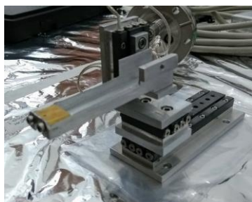
Figura 1. Protótipo do Manipulador UHV montado em bancada

Para o devido manuseio e montagem das peças foi estabelecido um protocolo de limpeza preliminar baseado na litaretura 2 . Após a limpeza e a adaptação de parafusos o primeiro protótipo foi montado como visto na Figura 1.