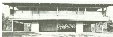
Figura 1. Vista da fachada Sul. (KULTERMANN, 1981, p.10).

A casa do arquiteto em Tóquio revela uma relação importante entre a casa tradicional japonesa e as inovações propostas pelo arquiteto. A residência mostra a tendência de aliar a tradição japonesa às novas condições de vida. A obra foi desenhada em 1951 e a construção foi finalizada em 1953. Foram utilizados materiais tradicionais como madeira e papel.