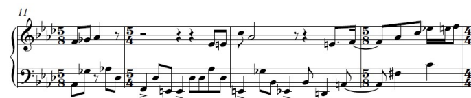
Figura 3. Melodia sendo feita na clave de sol e contracantos na clave de fá.

A análise dos arranjos também revela o uso frequente de contracantos 1 , principalmente entre o baixo e o piano, como também ser observado na música "Deixa" em que o baixo e a linha de mão esquerda do pianista fazem em uníssono uma melodia em contraponto com a da mão direita (Figura 3).