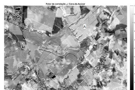
Figura 1: Mapa de correlação das curvas de NDVI

Após obter imagens multiespectrais de satélite de diferentes bancos de imagens, como do site Earth Explorer , correspondente a uma área próxima à Limeira-SP para diferentes meses de 2016, calculou-se o NDVI para cada um dos pixels destas imagens. Em um segundo momento, foram obtidos da literatura dados de referência de curvas do NDVI para diferentes culturas (e.g. cana-de-açúcar, eucalipto, laranja, etc), em função dos meses/estações do ano. A Figura 1 traz o mapeamento dos coeficientes de correlação entre as curvas calculadas e as curvas de referência da cana-de-açúcar, por exemplo, em que um pixel com valores mais próximo de 1 significa uma maior probabilidade da existência desta cultura na região.