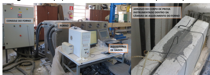
Figura 2. Equipamentos de ensaio e corpos de prova.

O processo de caracterização dos materiais para a produção dos corpos de prova, de sua moldagem, e de preparação dos ensaios seguiram um controle de qualidade padronizado (Figura 2), conforme as normas da ABNT.