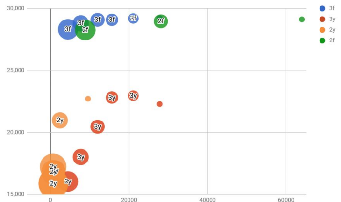
Figura 2. PSNR (eixo y) versus tempo de execução (eixo x). O tamanho das bolhas indica o tamanho do patch de baixa resolução. A legenda e a série têm 2 caracteres, o primeiro indica a razão entre o patches de alta e baixa resolução e o segundo é o nome da imagem.

Além disso também é interessante notar que estes resultados mostram um potencial ponto fraco na técnica estudada, mostrando não só que a qualidade do resultado não é independente da entrada como também identificando um subdomínio de imagens onde a técnica não atua como esperado.