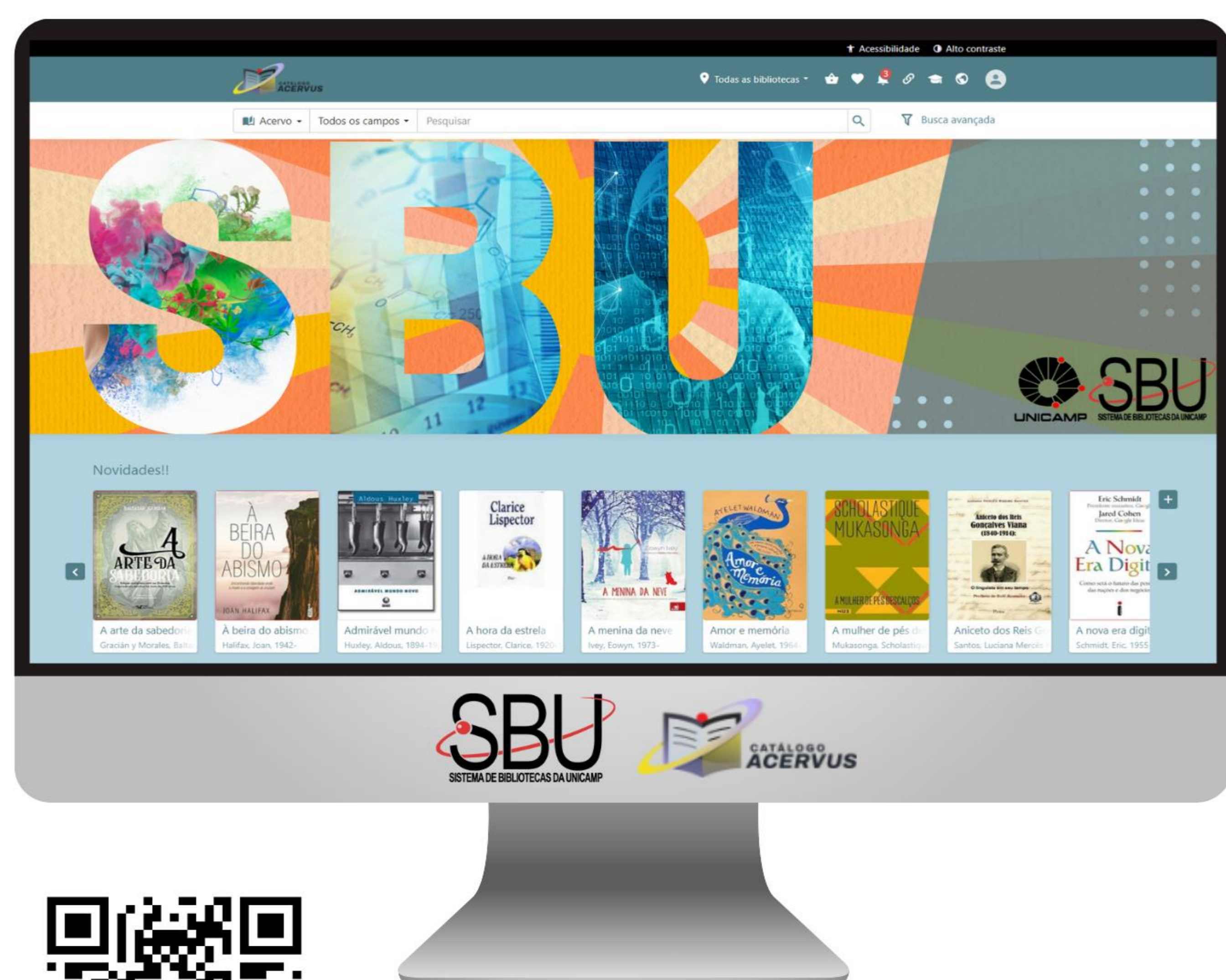
Figura 1: Nova Interface Catálogo Acervus

Os resultados mostraram que a interface reestruturada tornou o catálogo mais amigável e eficiente, elevando a produtividade dos usuários e facilitando o acesso às informações. Entre janeiro e setembro de 2024, o Catálogo Acervus registrou 3.829.502 consultas , um aumento de 302,1% em relação aos cinco anos anteriores.