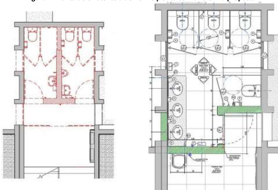
Figura 1: Planta do existente a demolir e planta com a reforma proposta

Um dos projetos desenvolvidos a partir deste material foi o PROJETO DE REFORMA DOS SANITÁRIOS DA SEC (Secretaria de Comunicação da UNICAMP), contemplando a reforma de áreas existentes com 4 sanitários que se apresentavam bastante deteriorados pelo uso e tempo de vida, transformando as áreas em dois sanitários maiores, sendo um para cada sexo por andar (Figura 01).