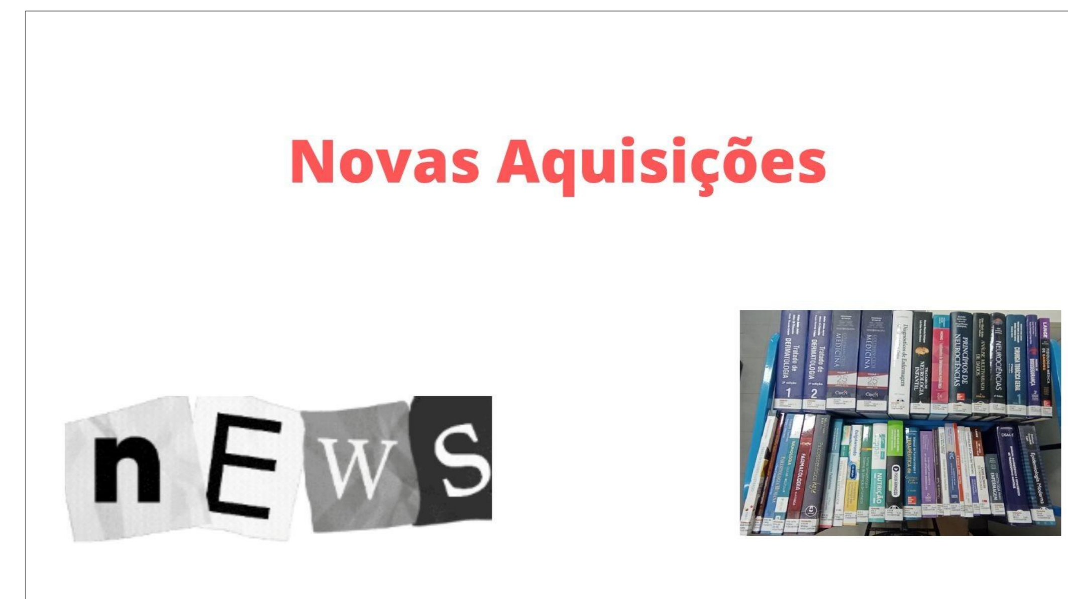
Figura 1: Divulgação de novas aquisições