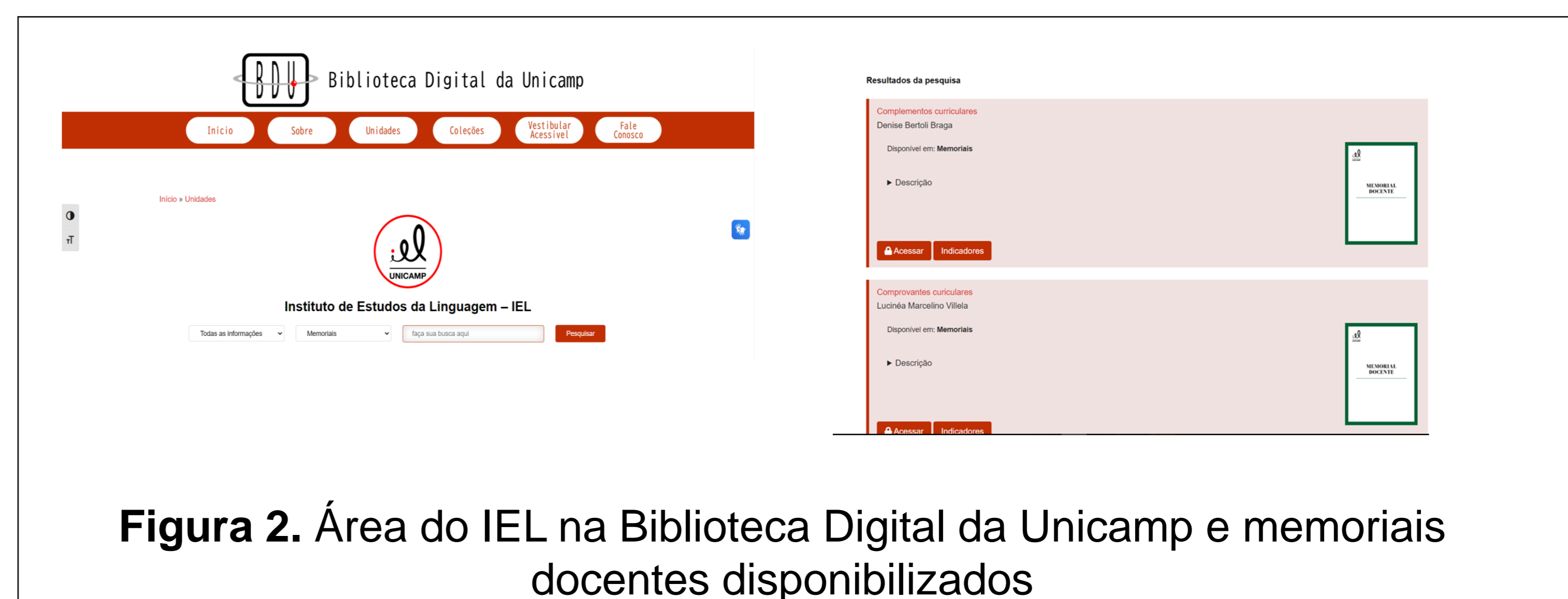
Figura 2. Área do IEL na Biblioteca Digital da Unicamp e memoriais docentes disponibilizados