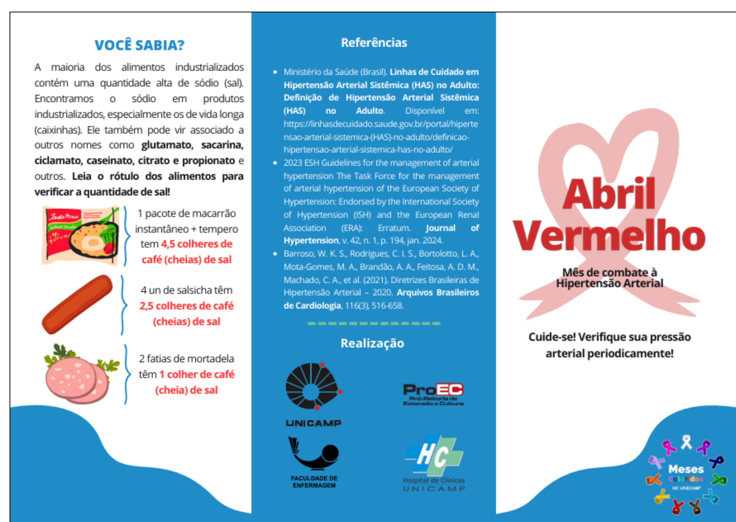
Figura 1 – Folder educativo “Abril Vermelho”.

Em 30/04/24, o folder foi distribuído pela equipe do projeto para os usuários do Ambulatório. Os resultados preliminares sugerem que o material educativo tem potencial de aumentar o conhecimento, e influenciar positivamente as atitudes e comportamentos de saúde dos usuários, incentivando a participação ativa no cuidado.