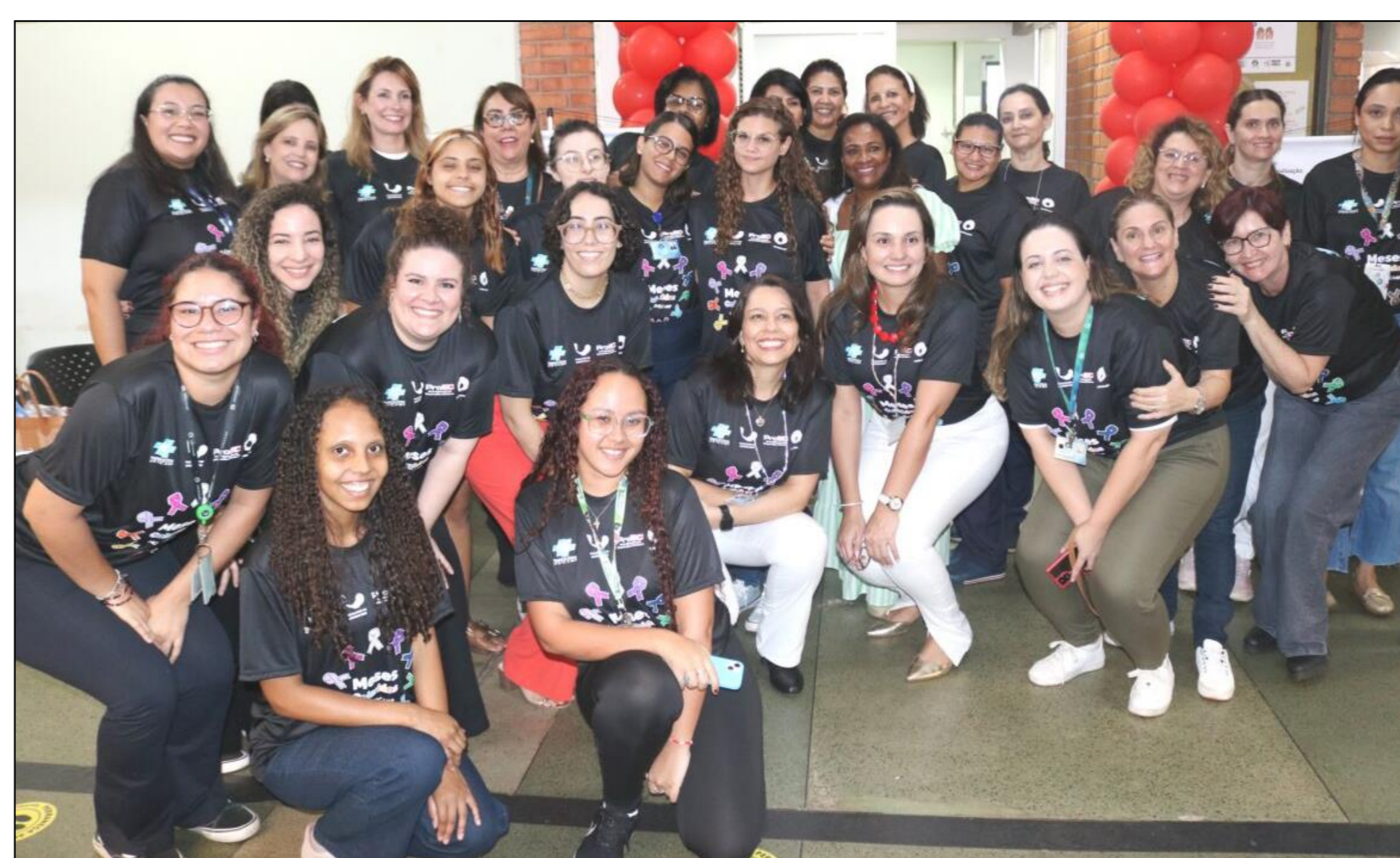
Figura 2 – Equipe do Projeto e do Ambulatório.

O folder foi elaborado e distribuído aos usuários do SUS informando sobre a hipertensão arterial, com potencial para melhorar o conhecimento destes usuários, sendo uma estratégia viável para disseminar informações sobre prevenção de doenças.