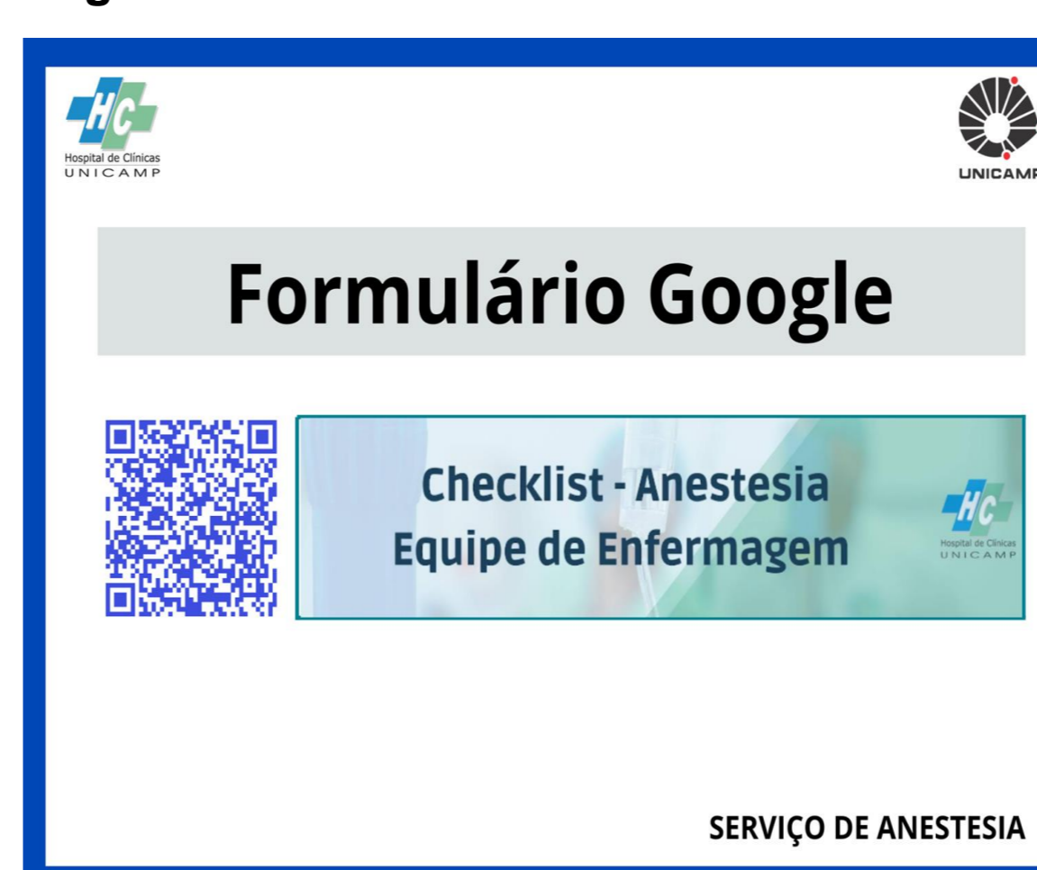
Figura 01: QRcode Checklist- Anestesia