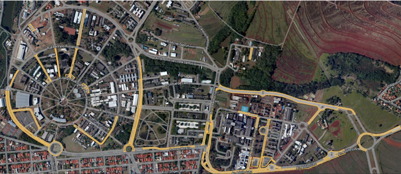
Pontos que serão recapeados

O investimento nas ações da Divisão de Manutenção no PPI totaliza R$36.097.884,98. Com a execução dos serviços, espera-se melhora das condições viárias no campus e do conforto dos usuários dos ônibus. No que se refere às ações voltadas às melhorias estruturais dos prédios, espera-se que futuramente seja permitida a implantação de um sistema de manutenção preventiva mais eficaz, definindo a periodicidade das ações da Divisão de Manutenção.