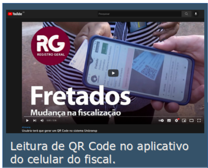
Leitura de QR Code no aplicativo do celular do fiscal.