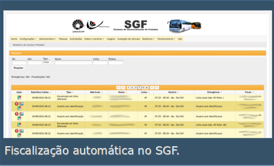
Fiscalização automática no SGF.

Referências: [1] - Sistema de solicitação de uso de Fretado - https://www.prefeitura.unicamp.br/apps/cad_fretados/ [2] - Unitransp - Uso de QR Code no Transporte Fretado - https://www.prefeitura.unicamp.br/2022/06/29/unitransp-uso-de-qr-code-no-transporte-fretado/