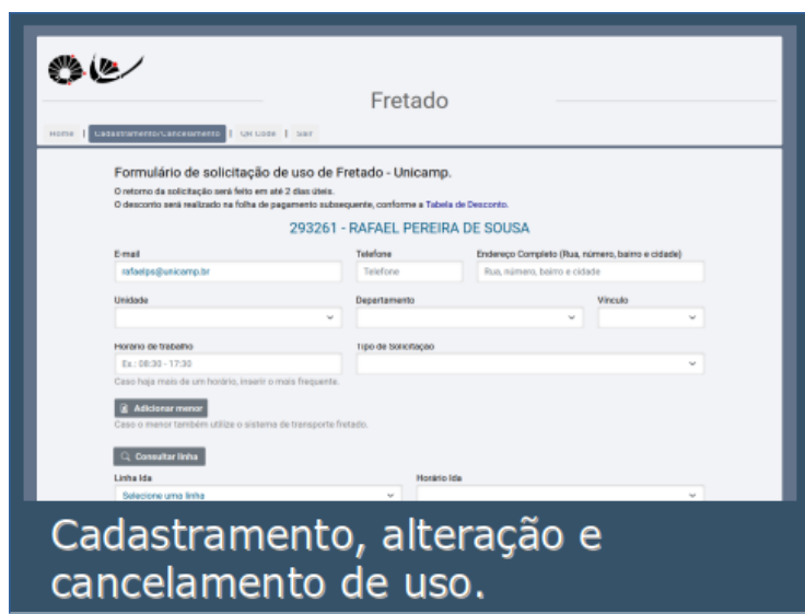
Cadastramento, alteração e cancelamento de uso.

A solução implantada fornece informações que permitem aos gestores do serviço fiscalizar o uso do transporte fretado, além de permitir que a comunidade universitária faça solicitações para a Unitransp de forma on-line. Hoje cerca de 3 mil pessoas entre funcionários, estagiários, funcamp e aposentados são beneficiados por esta solução.