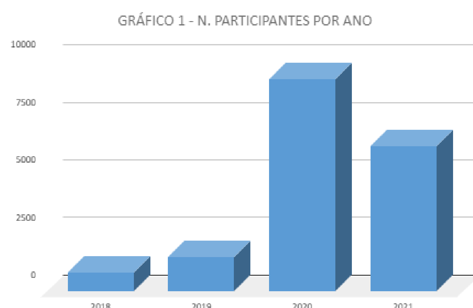
Gráfico 1 - Participantes por ano

Os números demonstram que a adaptação dos treinamentos, palestras e oficinas para o modo virtual não apenas viabilizou a continuidade da atividade de capacitação dos usuários, mas também possibilitou uma grande expansão não apenas da oferta de treinamentos, mas também no número de participantes. A iniciativa de disponibilizar as gravações das capacitações realizadas no canal do SBU no YouTube nos permitiu atingir um público ainda maior, reforçando a função social da biblioteca em oferecer o acesso à informação e se adaptar às necessidades educacionais da sua comunidade.