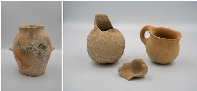
Figura 6 – Jarro e vasos cananitas

O processo curatorial opta por ilustrar e fornecer vestígios materiais para tentar tornar visíveis as histórias bíblicas, atribuindo funções aos objetos e associando-os a um passado; essa é uma forma de superar a invisibilidade irreversível do passado (Bittencourt, 2000-2001). Em seguida, observa-se a apresentação de quatro cerâmicas: uma identificada como “jarro cananita” e as outras três, em conjunto, como “vasos cananitas”. Todas as peças estão dispostas no mesmo painel temático, que ilustra o desenvolvimento da manufatura das cerâmicas na região do Levante. Os tombos dos artefatos, da direita para a esquerda, conforme a imagem 6, são: OAR 0059, OAR 0199, OAR 0203 e OAR 0247