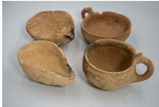
Figura 3 – Lamparinas abertas

Os próximos artefatos a serem analisados também se apresentam em conjunto e consistem em quatro cerâmicas identificadas como “lamparinas abertas”. Conforme a figura 3, os tombos correspondentes são: OAR 0184, OAR 0245, OAR 0457, OAR 0246. Todos os exemplares fazem parte da doação de 2012 e, após o processo de revisão e seriação, mantiveram a datação original.