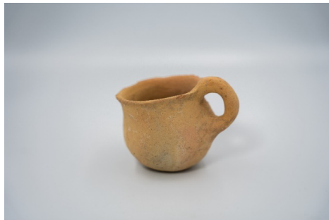
Figura 1 – Jarro com alça (OAR 0247)

cerâmicas da região do Levante. O jarro cerâmico apresenta alça levemente elevada e inclinada, borda curva externa, base reta e corpo arredondado, assemelhando-se a uma xícara. Este tipo de jarro é comumente encontrado na fase protourbana do período do Bronze Antigo I, caracterizada por tecnologias aprimoradas e padronização crescente. Observa-se a continuidade na produção de cerâmicas semelhantes ao período do Bronze Antigo IA e IB, com o surgimento de tigelas carenadas com revestimento vermelho, xícaras com alças altas, jarras com alça e bico em forma de coluna e cubas com bico.