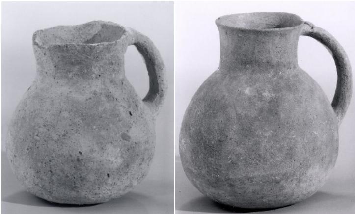
Figura 3 – Potes com alças

Como mencionado, o processo de seriação consiste na análise comparativa de objetos com características semelhantes, permitindo a reconstrução de sequências cronológicas e de biografias culturais. Esse método pode ser aprimorado pela comparação com outras coleções museológicas que dispõem de documentação mais consistente sobre o contexto original dos objetos. No MAB, essa prática tem sido adotada por meio do cotejamento tipológico com acervos de instituições de referência, como o Museu Metropolitano de Nova York (figura 3), cuja base virtual reúne uma ampla coleção de cerâmicas do Levante, possibilitando a verificação e o cruzamento de informações.