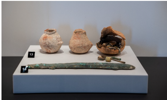
Figura 5 – Vasos de barro “estilo cofre”

Os artefatos analisados são apresentados em conjunto na expografia como “vasos de barro contendo metais preciosos”. Dessa forma, três vasos são expostos acompanhados de um lingote de bronze (figura 5).