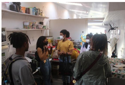
Figura 2. Oficinas de Vivências em Erer no Projeto Mulheres em Ação

O compromisso de problematizar essa discussão, fortalecer a subversão dos mecanismos de regulação e as rupturas com os silenciamentos históricos produzidos na sociedade brasileira sobre as mulheres afrobrasileiras, quilombolas e indígenas, destacando seus protagonismos, suas histórias de resistências, seus processos de (re)significação no mundo, resultou na potencialização de várias ações articuladas de pesquisa, ensino e extensão, no aprofundamento dos estudos sobre interseccionalidade e a aproximação com mulheres nos seus espaços de atuação e formação. Nas inserções realizadas nas comunidades, destaca-se as ações articuladas com Projeto Mulheres em Ação, em que o coletivo de discentes extensionistas do Programa Memorial Antonieta de Barros articulados ao Neab desenvolvem oficinas de vivências em Educação das Relações Étnico-Raciais com mulheres periféricas nos bairros Brejarú e Frei Damião no município de Palhoça em Santa Catarina. No encontro, a discência do curso de Design de Moda da Udesc estabeleceu diálogos com conhecimentos e saberes com as mulheres da comunidade, potencializando experiências e fortalecendo redes de afeto mútuo, coletividade e ações afirmativas interseccionais.