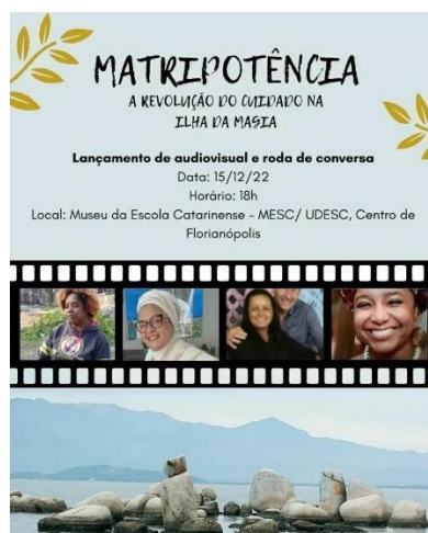
Figura 3. Primeiro lançamento do audiovisual no Mesc/Udesc

Com o primeiro lançamento do audiovisual em dezembro de 2022, realizado no Museu da Escola Catarinense (Mesc) da Udesc, destaca-se a importância da produção inédita de documentário de audiovisual que contempla ações indissociáveis de pesquisa, ensino, extensão e cultura; a visibilidade da pauta étnicoracial e suas interseccionalidades - gênero, raça e classe – temática pouco discutida e necessária no território catarinense, brasileiro, latino-americano e internacional; a visibilidade de trabalhos extremamente necessários em se tratando de política pública, ao trazer para a pauta a discussão dos estudos decoloniais e do feminismo negro; a produção de cine-verdade aproximando o filme da realidade das personagens e de possíveis espectadores, com a captação de imagens dos cotidianos de suas práticas reconhecidas pela dimensão do cuidado junto a suas comunidades; o registro audiovisual das práticas, retratando serve fragmentos das realidades das entrevistadas, da linguagem corporal, das performances cotidianas, dos objetos em jogo, das formas de sociabilidade auxiliando na compreensão do papel e a importância dessas figuras em seus contextos.