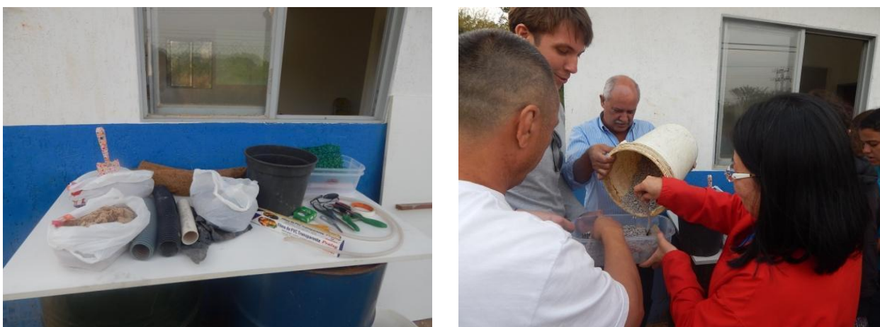
Figura 8. Oficina teórica sobre o sistema de bacia de evapotranspiração (BET), com a construção de maquetes.

No presente projeto foram realizados três mutirões diferentes, um para cada tecnologia implantada. Os mutirões tinham a duração de um período (manhã ou tarde) e eram precedidos de uma oficina teórica sobre o mesmo sistema. Nestas oficinas eram mostradas imagens dos sistemas e eram dadas explicações sobre o seu funcionamento, eficiência e aspectos construtivos. Além de aulas expositivas, também eram realizadas atividades de caráter mais prático durante as oficinas, como a construção de maquetes (Figura 8), a observação de protótipos dos sistemas e de materiais e a realização de cálculos relacionados ao dimensionamento.