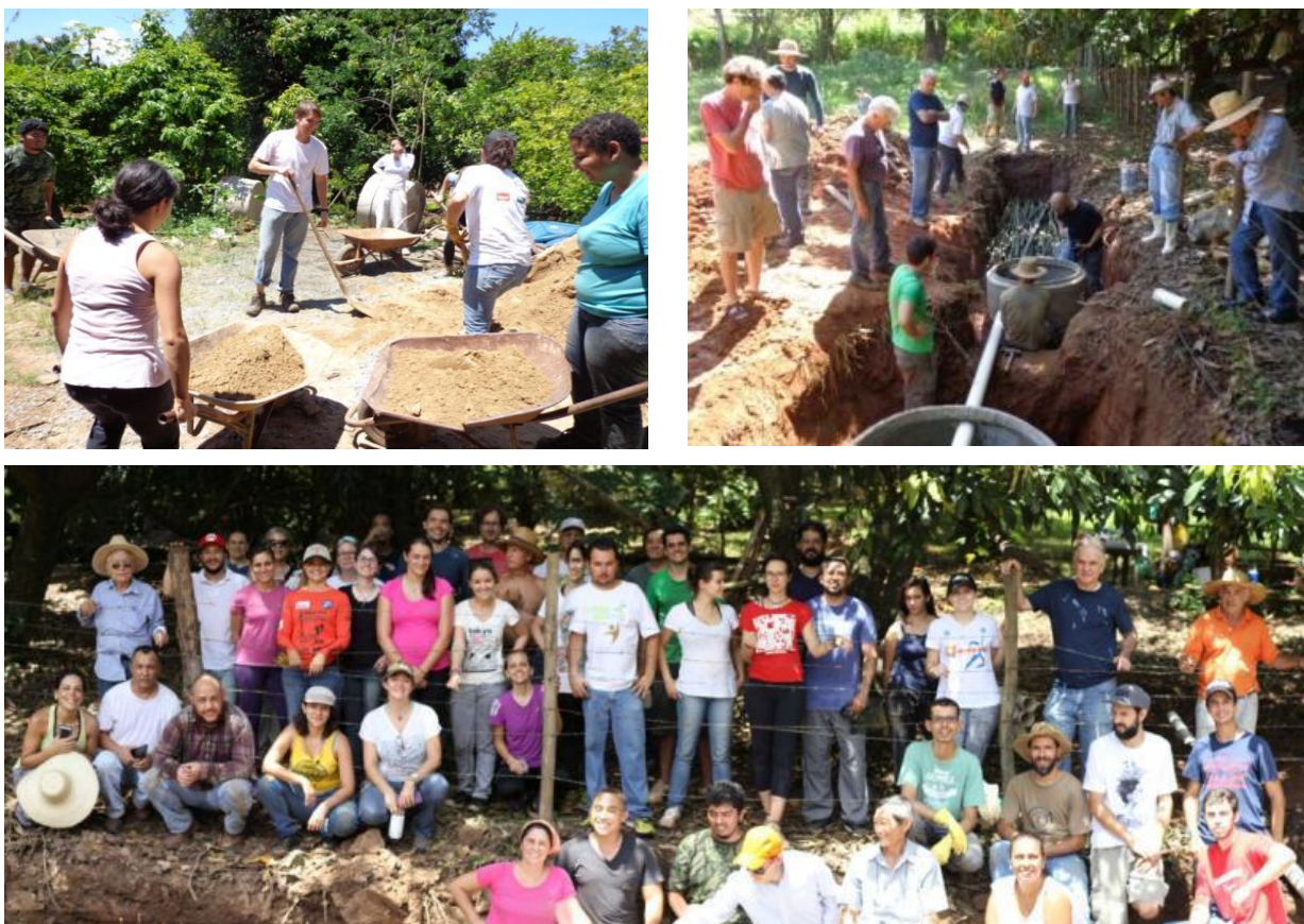
Figura 9. Imagens do mutirão de construção dos sistemas de tratamento de esgoto.