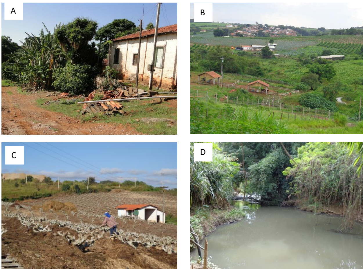
Figura 2. Comunidade rural de Pedra Branca. A e B) Moradias da região. C) Campo de cultivo de figo. D) Rio Capivari.

e Capivari-Mirim, importantes mananciais abastecedores dos municípios de Campinas e Indaiatuba.