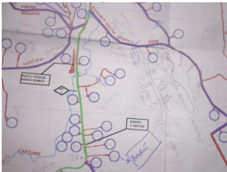
Figura 3. Mapa reelaborado depois da caminhada transversal.

de um antigo mapa que a Associação tinha elaborado em 2001 com os associados da época e na anotação de algumas das propriedades que seriam visitadas, de pontos de referência e de rotas de acesso (Figura 3).