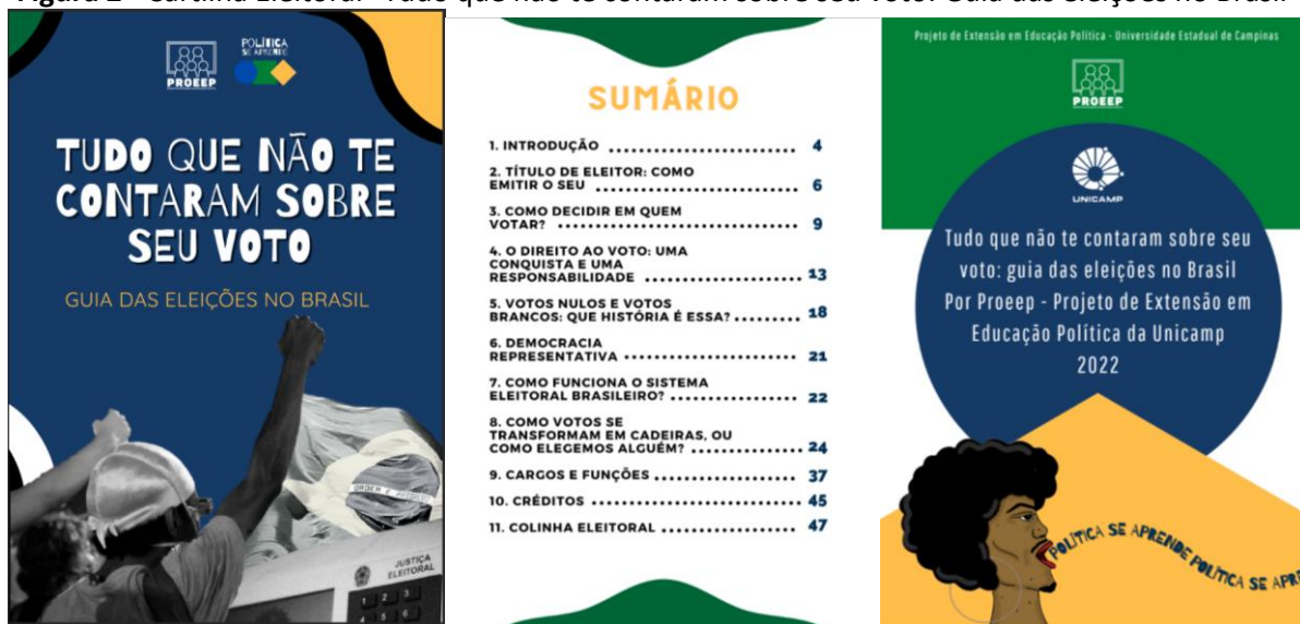
Figura 2 - Cartilha Eleitoral “Tudo que não te contaram sobre seu voto: Guia das eleições no Brasil”