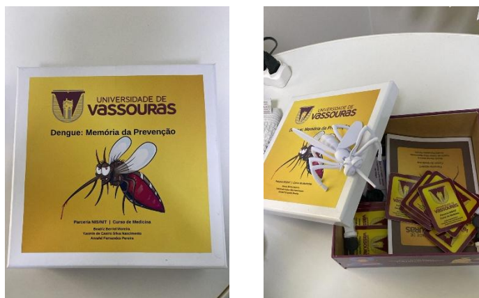
Figura 2. Jogo educativo

Produtos educativos são idealizados a fim de atenderem à demanda identificada pelos estudantes e obrigatoriamente, devem estar relacionados aos temas dos ODS. Eles são utilizados na comunidade, contribuindo para melhora da sua qualidade de vida. Abaixo estão jogos sobre prevenção da dengue produzidos pelos estudantes e disponibilizados aos moradores, em consonância ao ODS 3: “Saúde e Bem-Estar”.