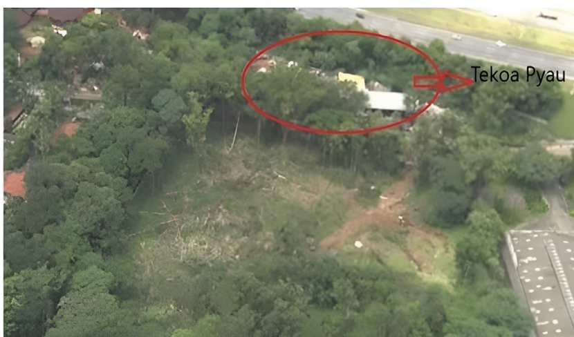
figura 10. Aerofotografia da área desmatada.

O desmatamento e o projeto da construtora Tenda de construção de condomínio em território adjacente à Terra Indígena constitui exemplo sólido da continuidade dessa lógica de cerceamento territorial da TI Jaraguá. A magnitude do desmatamento, assim como o impacto para as comunidades guarani, devido à proximidade limítrofe, pode ser observada em imagem abaixo: