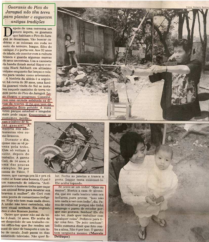
figura 7. Íntegra do jornal O Estado de São Paulo, edição de 19/10/1995.

narrativa é sempre voltado para enfatizar os elementos supostamente “aculturadores” presentes entre os Guarani “urbanos”: a utilização de camiseta de banda de rock, o domínio da língua portuguesa na comunidade e a habitação em alvenaria, além da tentativa implícita em se descaracterizar algum suposto aspecto de “religiosidade indígena” – “Índio costuma dizer que foto rouba a alma. Não é por isso. O garoto tem vergonha mesmo”.