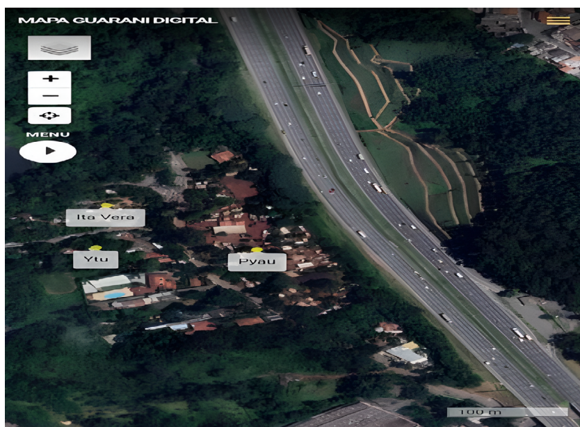
figura 2. Aldeias Tekoa Ytu, Pyau e Ita Vera (a esquerda) e rodovia dos bandeirantes a direita, na entrada da TI.

A abertura da Rodovia dos Bandeirantes, em 1978, impulsionou os conflitos entre os Guarani e os não-indígenas em decorrência de sua localização, pois este eixo rodoviário, ao contrário da via Anhanguera, contorna o morro do Jaraguá a leste, onde se encontram as aldeias Tekoa Ytu e Pyau, as mais antigas da região, conforme pode se observar abaixo: