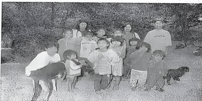
Aldeia tem 62 adultos e crianças que viviam na miséria até pouco tempo atrás figura 9. Fotografia da notícia de Lux Jornal, edição de 25/08/1997.

13. Disponível em: https://terrasindigenas.org.br/en/terras-indigenas/3707 . Acesso: 29/08/2024.