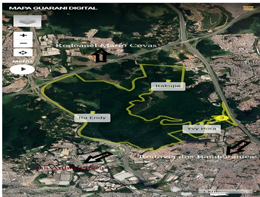
figura 1. Terra Indígena Jaraguá (em amarelo) e os eixos rodoviários (setas pretas).

do Morro do Jaraguá/ TI Jaraguá, cerceada por três diferentes eixos rodoviários, conforme pode se observar abaixo: