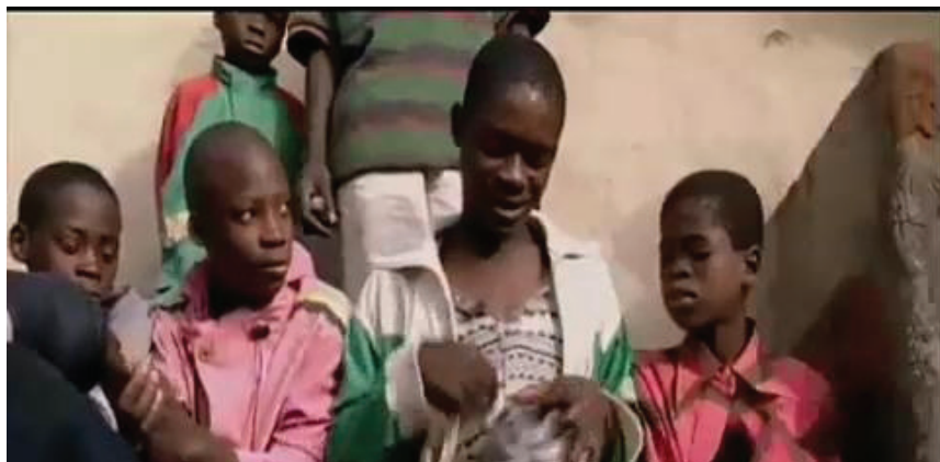
Imagens do filme A bola (2001), de Orlando Mesquita.