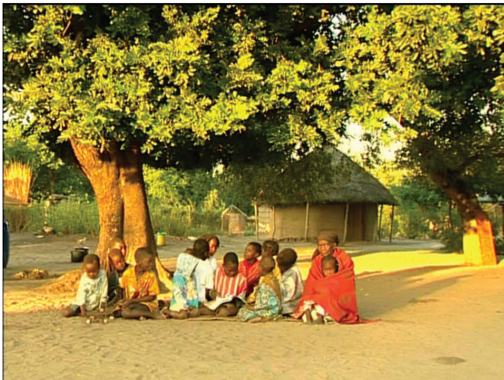
Imagem do filme Mãe dos netos (2008), de Isabel Noronha e Viviam Altman.

O relato, porém, não para aí. France, Emídio e Mistéria, filhos da terceira esposa de Francisco (Almerinda, que também faleceu), juntaram-se ao grupo dos netos adotados de Elisa. Alegria, a quarta esposa de Francisco, também, ao morrer, deixou sua única filha (Vastinha) para a avó. Elisa sintetiza o que acabou ocorrendo com quase todas as esposas do filho: “Todas as outras esposas de Francisco morreram.” Tristeza, a última esposa de Francisco, e que ainda não tinha filhos, abandonou a família Muchanga após a morte do marido, deixando a sogra sozinha com quatorze netos. Em cena, mostram-se aspectos dramáticos da situação do núcleo familiar: um grande número de crianças pequenas, a idade avançada da avó, sua impossibilidade de ir para a machamba (roça) e de cuidar de todos os netos. Tudo isso expresso na preocupação da debilitada avó: “Como é que eles vão crescer?”