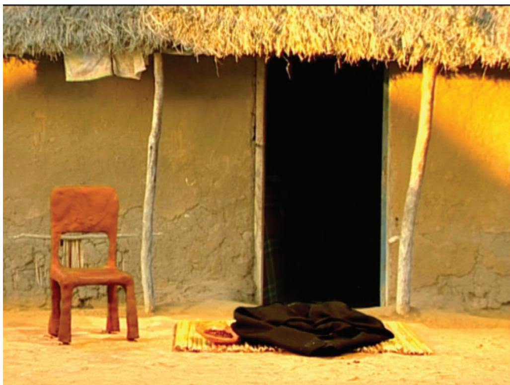
Imagem do filme Mãe dos netos (2008), de Isabel Noronha e Viviam Altman

A cada falecimento, uma ausência. Esta é significativamente marcada no recurso cinematográfico utilizado por Isabel e Vivian. Na animação, toda vez que a narrativa de Elisa Mabesso aponta a morte de alguma de suas noras, automaticamente as personagens que estavam cobertas por uma capulana 8 desaparecem como um fantasma, deixando apenas o vazio manifestado por ausência no interior daquele pano. É como se literalmente os corpos fossem fantasmas. De presença concreta, passam a ser memória. Memória que, do mesmo modo que a capulana que fica, não deixa de ser presença – ainda que ausente. Os espaços vazios – mas não necessariamente desocupados – destacam a liminaridade do corpo vitimado pela AIDS.