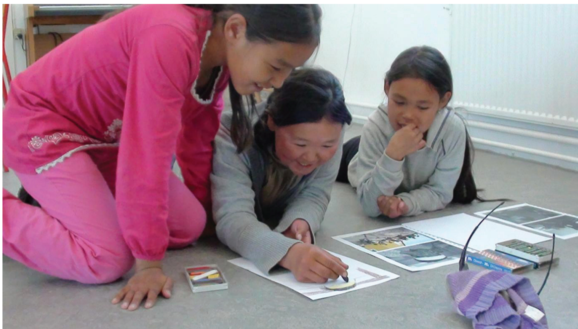
Figura 8: Workshop com os alunos de Diilerilaaq.