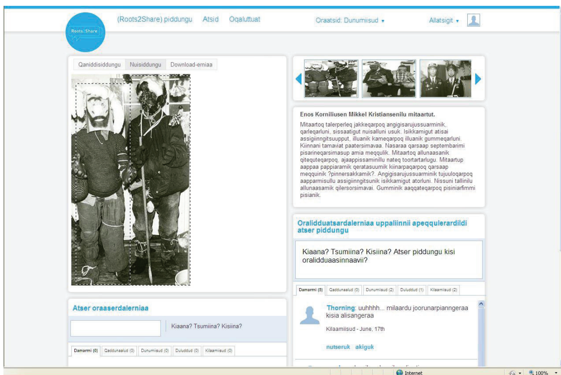
Figura 3: Imagem do “fórum digital de patrimônio” do Roots2Share, disponível em quatro línguas diferentes. Esse projeto multilinguístico é uma interessante pesquisa piloto, e levanta, na prática, alguns desafios técnicos e sociais. O site é construído em estreita colaboração do grupo de pesquisa em interatividade [2] da Hogeschool Utrecht. A Fundação Mondriaan forneceu apoio financeiro.