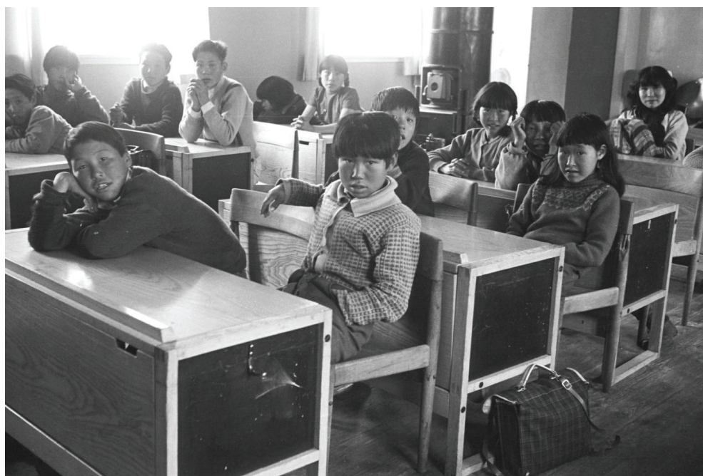
Figura 7: Uma menina nos contou que sua mãe apontou para uma das fotos na parede da sala de aula e disse: “Olha, aquele garoto sentado à esquerda é seu pai biológico.” Aquela foi a primeira vez que a menina via uma foto do pai. Ele morreu quando ela tinha apenas cinco anos, e essa foto reavivou sua memória sobre ele. (Foto de Gerti Nooter, 1967).

Também fizemos visitas inspiradoras às classes mais avançadas (alunos de quinze-dezesseis anos) na escola da capital do distrito, Tasiilaq, a maior comunidade na Groenlândia oriental (com uma população de 1.850 pessoas), e nas escolas locais de Diilerilaaq (150 habitantes; a Groenlândia tem 56 mil habitantes, sendo a maior ilha do mundo). Alguns alunos se impressionaram com as fotografias (“Eles realmente cortavam focas na cozinha?”); para outros, as fotografias produziram experiências emocionais inesperadas.