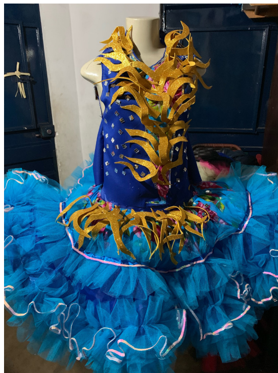
Fotografias 1 e 2: vestido de noiva e de rainha da Balão Junina Cariri, costurado por Pinto no bairro João Cabral em Juazeiro do Norte-CE. 27 de junho de 2019.

Por um lado, Ribeiro (2002) relembra que as festas juninas acontecem no Brasil desde o século XVI, trazida pelos jesuítas. “As celebrações se mostravam muito eficazes para atrair a atenção dos indígenas para a mensagem catequizadora dos padres, em especial as festas que conjugavam fogueiras, rezas e alegria” (RIBEIRO, 2002, p. 28). De tal modo, esse período de festas juninas se atrelava à época do ano em que os índios realizavam rituais de fertilidade, tendo em vista que, geralmente, em muitas regiões brasileiras, eram as épocas de seca e de preparação dos plantios. Assim, segundo a autora, a tradição se manteve nos meios rurais dentre o aspecto cívico e religioso, trazendo as comemorações coloniais em variações regionais do louvor aos santos de junho. Por outro lado, a dança da quadrilha chega ao Brasil, de acordo com Ribeiro (2002), com as missões artísticas francesas, cuja lembrança no sotaque brasileiro se faz presente até hoje, a exemplo de termos como “balancê” 4 . Como explica Rueda (2006), a quadrilha junina brasileira é uma manifestação sincrética herdada culturalmente através da história.