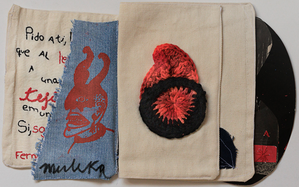
Imagem 3 - De diabe/Cuidado