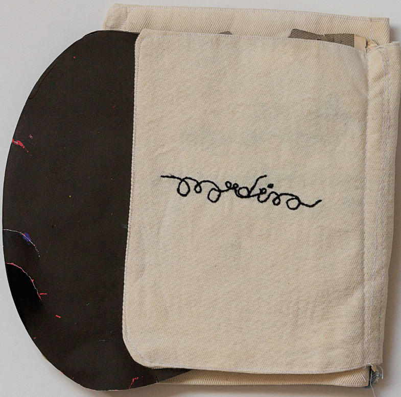
Imagem 7 - mardina.