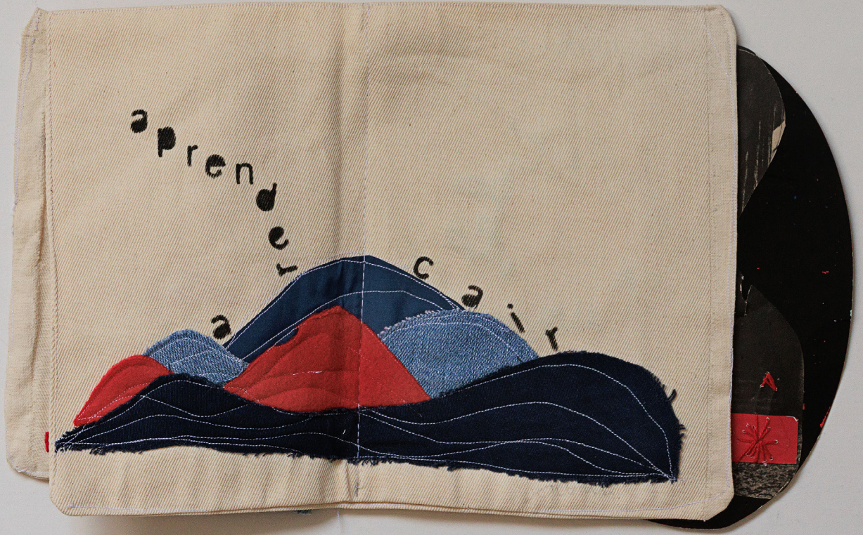
Imagem 4 - Aprender a cair