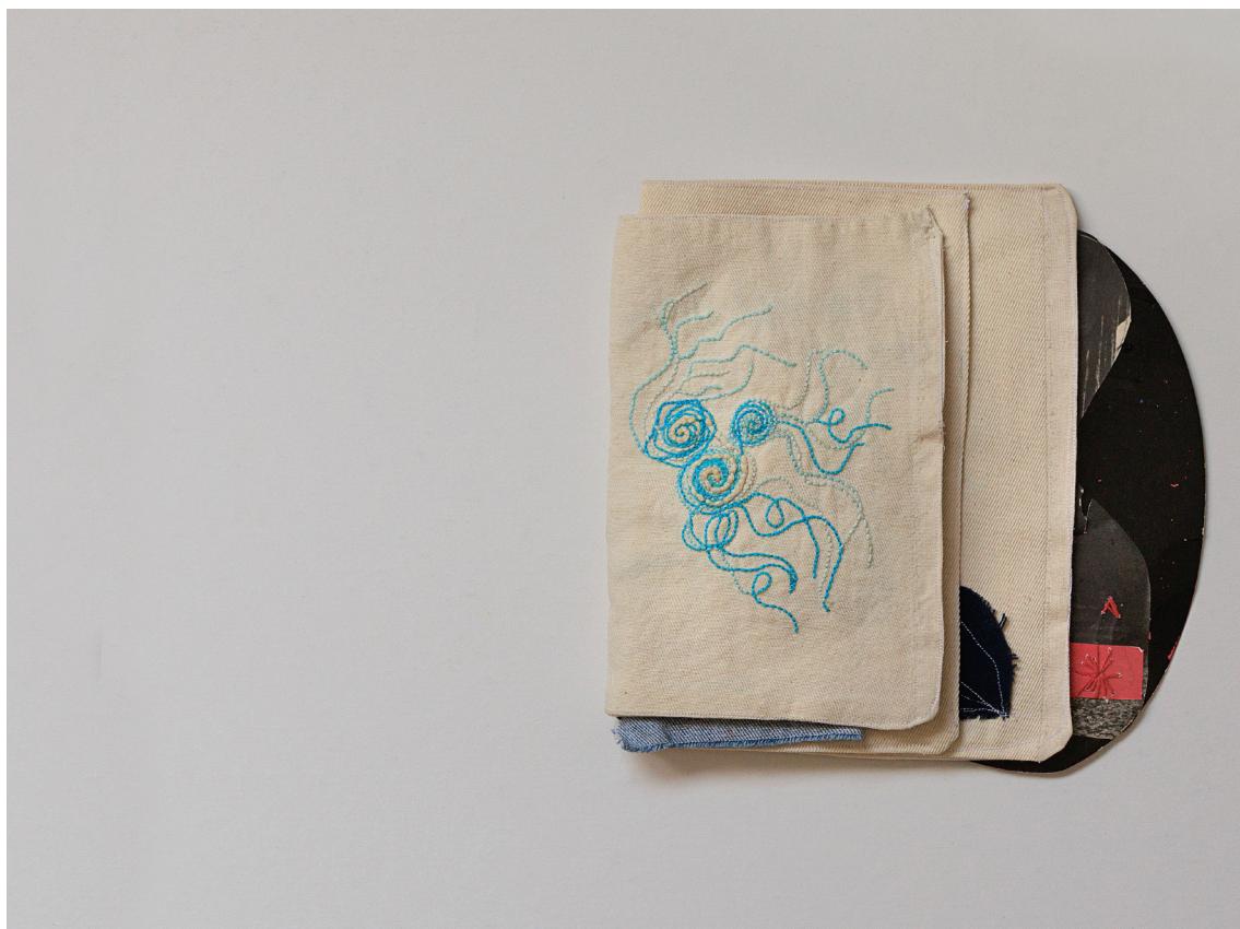
Imagem 1 - Vazios circulares