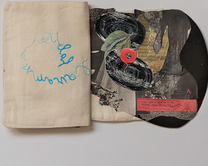
Imagem 5 - Casar com a escrita e habitar o avesso