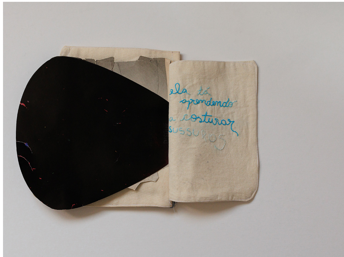
Imagem 6 - Ela tá aprendendo a costurar sussurros.