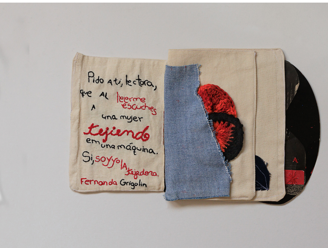
Imagem 2 - La tejedora