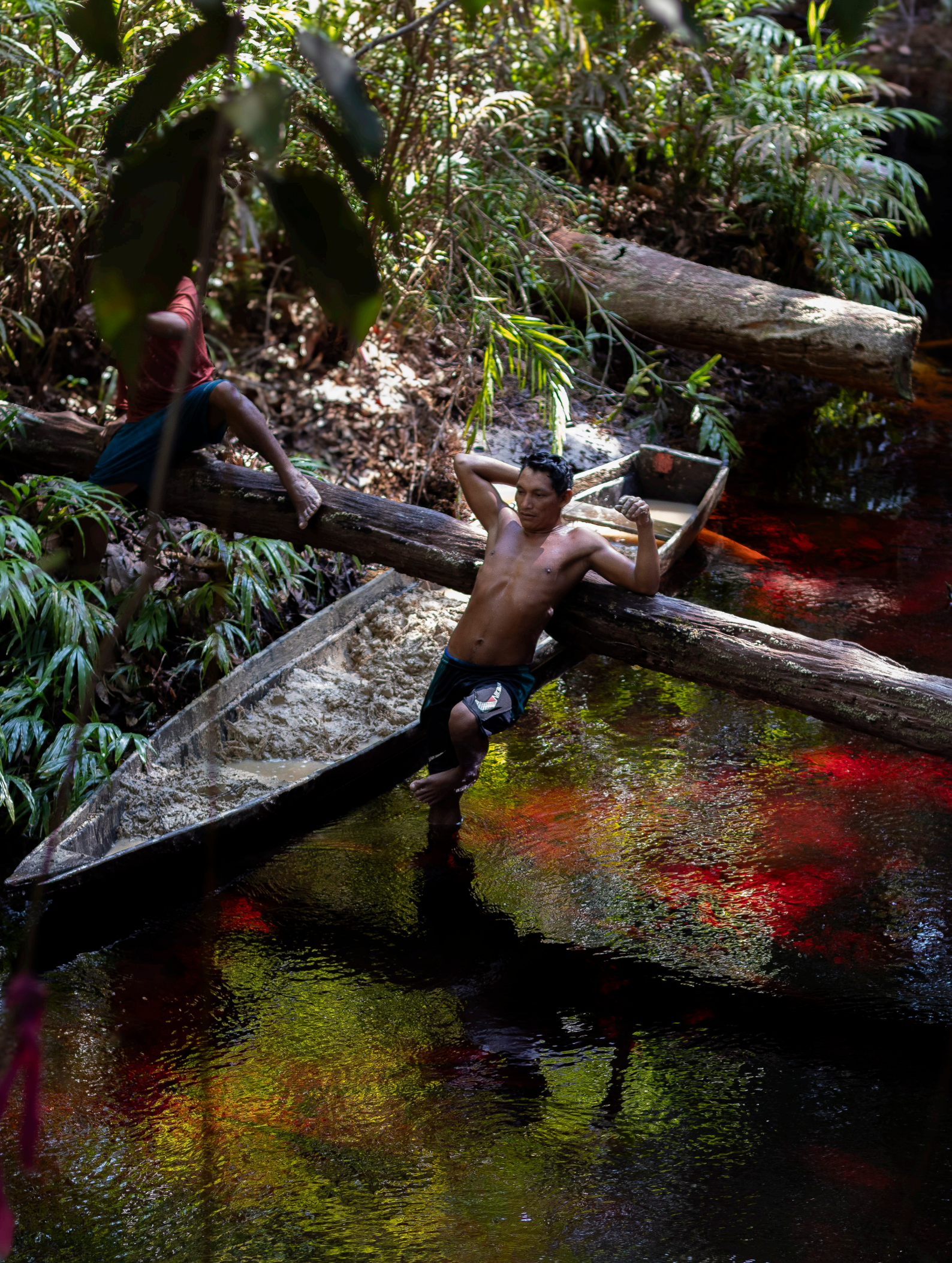
Foto 5 – Rodrigo, jovem yuhupdeh, ao lado da canoa de timbó batido e misturado com argila.