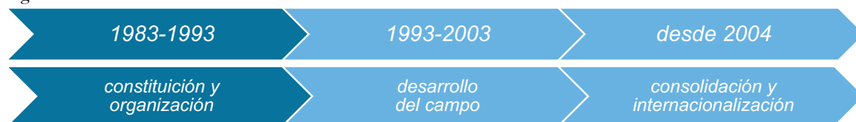
Figura 2 – Períodos de la historia de la SBEC

Un Dossier conmemorativo de los 40 años nos pareció el formato adecuado, recogiendo, de este modo, impresiones sobre la Sociedad de Educación Comparada desde la dimensión temporal, como un convite a reflexionar sobre las cuatro décadas de una asociación brasileña de investigadores en dos perspectivas que permitiesen captar: la mirada para el interior brasileño de la investigación comparativa en un primer movimiento; y captar la mirada de fuera para dentro, desde el exterior en un segundo movimiento.