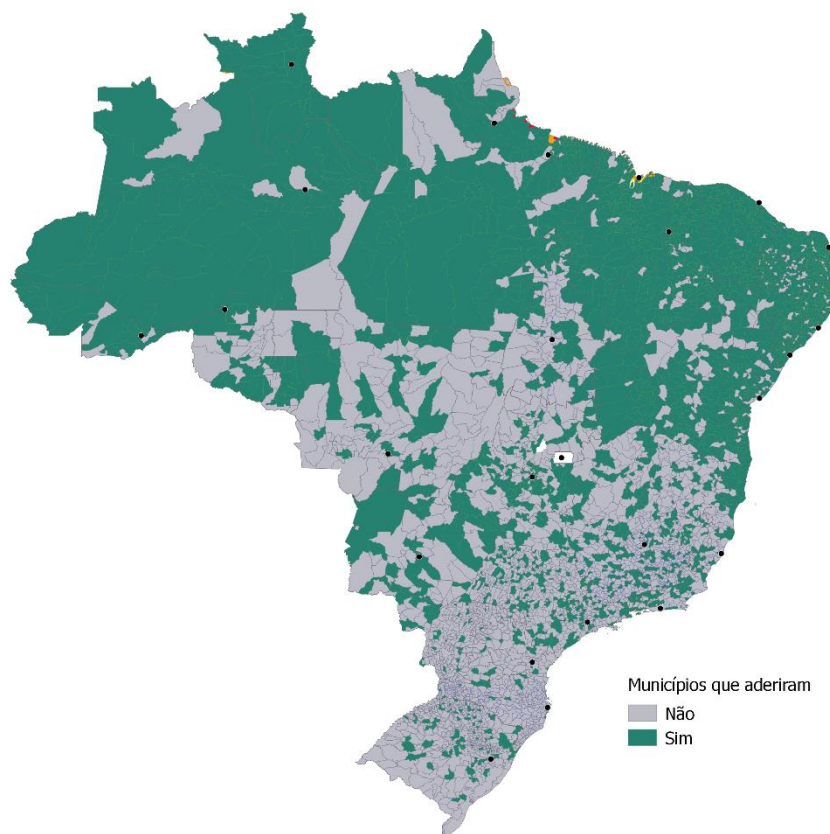
Figura 2. Mapa do Brasil com municípios que aderiram ao Programa Criança Feliz.