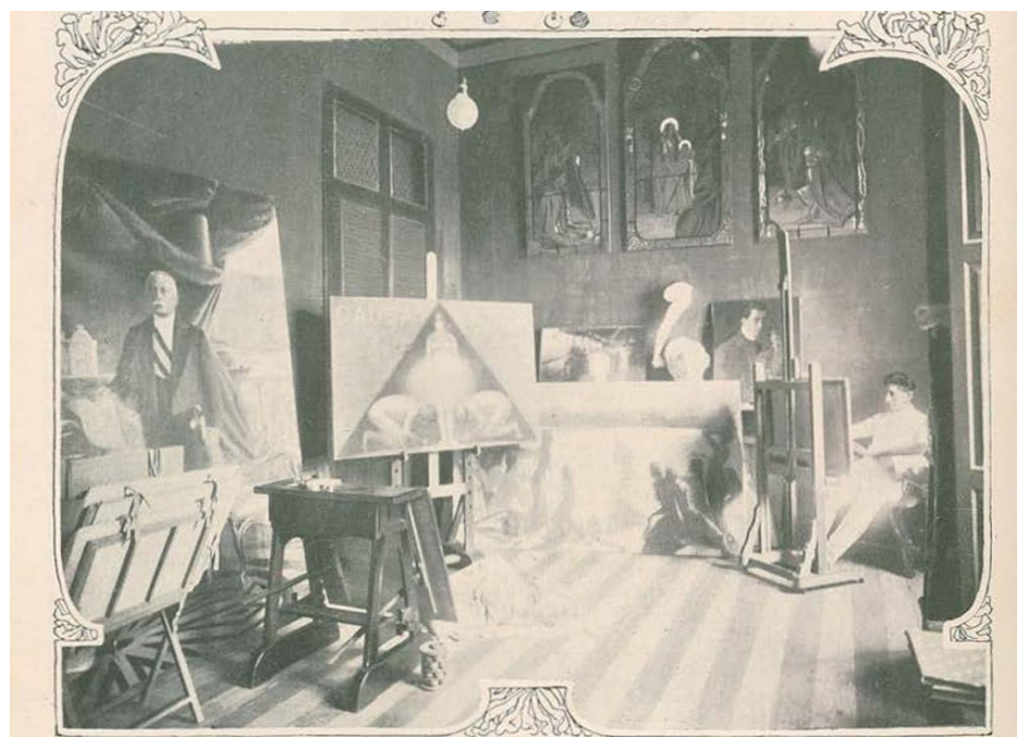
Figura 3: BRAGA, Theodoro. Theodoro Braga em seu atelier. Fotografia. In: Ilustração Portuguesa , Lisboa, n. 263, 1911. p. 16. Disponível em: https://hemerotecadigital.cm-lisboa.pt/obras/ilustracaoport/1911/N263/N263_master/N263.pdf . Acesso em: 01 de out. 2025. (À esquerda, o quadro analisado na crítica, que hoje faz parte do acervo do Instituto Histórico e Geográfico do Pará – IHGP, porém, devido suas grandes proporções, está na reserva técnica do Museu da Universidade Federal do Pará).

Para os leitores que acompanhavam as publicações de Alfredo Sousa desde suas primeiras críticas veiculadas no Folha do Norte , causava certo estranhamento a opinião expressa pelo crítico sobre o novo retrato de Theodoro Braga. Em um contexto marcado pelo acirramento da rivalidade política entre lemistas e lauristas , fosse Braga ou qualquer outro pintor de renome a retratar Antônio Lemos, este certamente contaria com a desaprovação de Sousa. Diante do episódio, para um questionamento sugestivo: teria o crítico mantido o mesmo parecer caso Theodoro Braga tivesse retratado, com igual suntuosidade, o Sr. Lauro Sodré? [Figura 3]