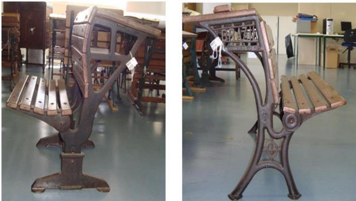
FIGURA 1 – Cadeiras em ferro fundido e madeira