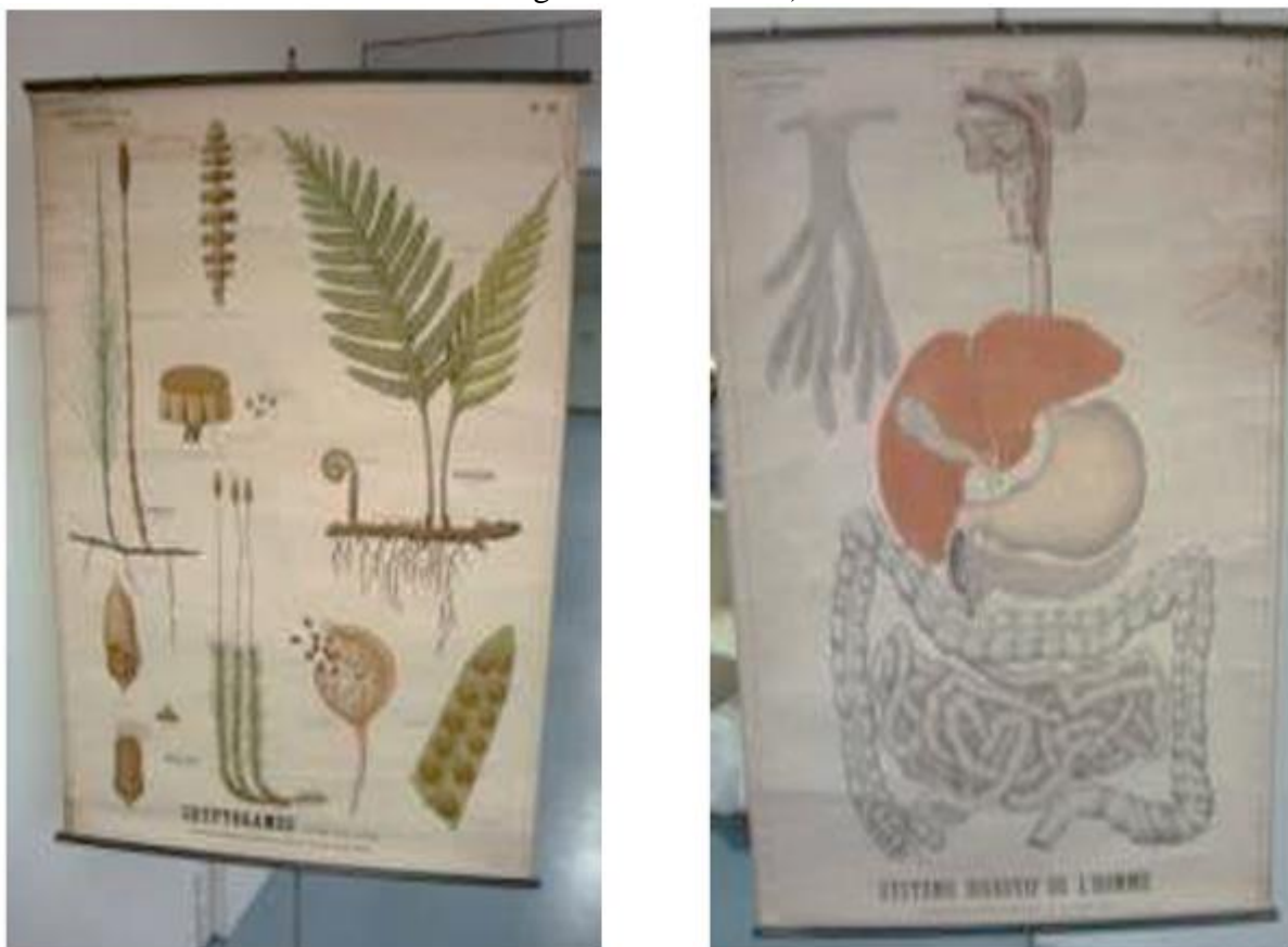
FIGURA 2 – Quadros Parietais (História Natural: Samambaia, musgo e cavalinha/ Aparelho digestivo do homem)