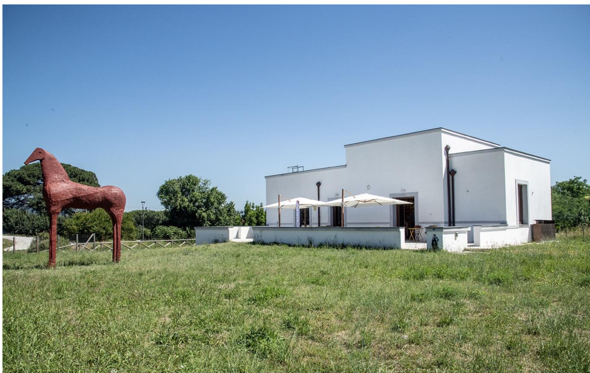
FIGURA 2 – Casina Rosellino , sede do Pompeii Children's Museum , localizada na insula 5 da Regio II