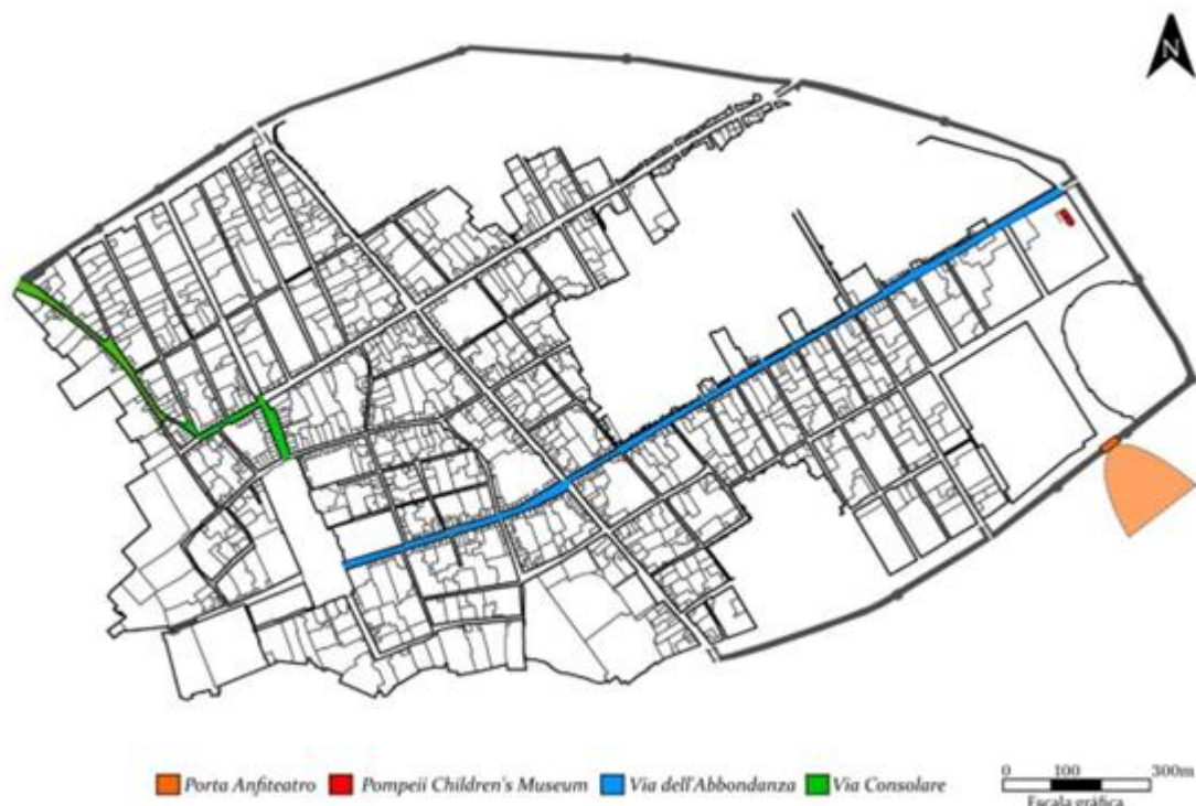
FIGURA 3 – Localização do Pompeii Children's Museum , na proximidade do ingresso de Porta Anfiteatro, e dos dois principais eixos viários de Pompeia: Via dell'Abbondanza e Via Consolare

Nos inícios do séc. VI a.C., Pompeia era um assentamento etrusquizado, característica comum aos principais centros da Campânia por um processo de urbanização que monumentaliza o habitat : um salto qualitativo que acomete sem distinção étnicas as regiões mais proeminentes da Itália antiga, desde a Etrúria ao Lácio e à Magna Grécia (Cerchiai, 2017, p. 5).