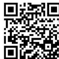
Fig. 7: Documentação da obra de arte "Obliterações", Foto de Alessandra Melo Link: https://www.territoriosensíveis.com/galeria-z42 .