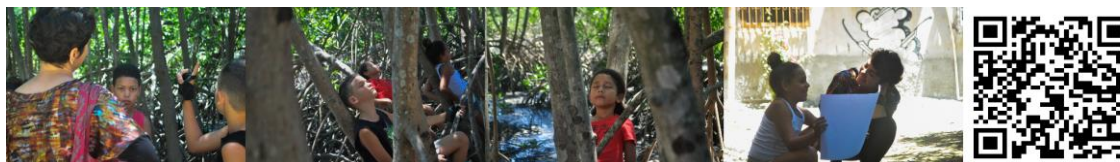
Fig. 2: Ação com as crianças

como parte de seus corpos/casas, bem como a descoberta de seus movimentos, sons e raízes voadoras.