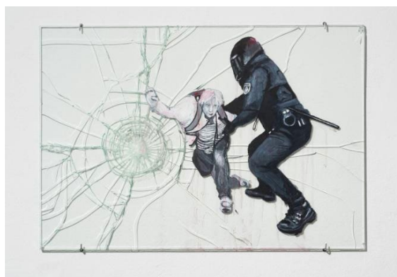
Imagens 5 e 6 - Dora Longo Bahia, A polícia vem, a polícia vai [série] , 2018. Tinta acrílica sobre vidro laminado quebrado, 50 x 80 cm.