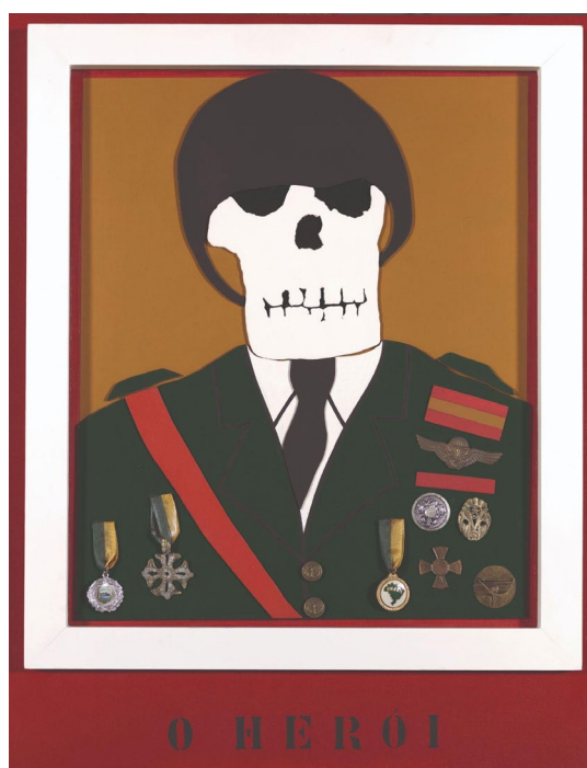
Figura 1 - Anna Maria Maiolino, O Herói , 1966/2000. Acrílica sobre madeira, metal e tecido, 59 x 46 x 7 cm. Acervo MASP.

na indústria cultural, no movimento Expressionista e nas críticas sociais e políticas latentes do cenário nacional da época.