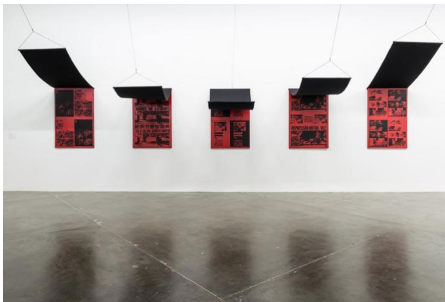
Figura 2 – Antonio Manuel, Repressão outra vez - Eis o saldo [série] , 1968. Cinco serigrafias sobre madeira, tecido e corda; 122 x 80 cm (cada). Acervo do Museu de Arte Moderna de São Paulo.

produzidas nesse contexto geralmente assumiam uma forma plana e apresentavam pouca complexidade estilística, sendo concebidas em grande escala. Em complemento às imagens, era comum combinações de escritos sarcásticos e palavras de ordem como estratégias de crítica combativa, criando assim uma abordagem estética alinhada ao aspecto midiático ao ecoar as manchetes de jornais.