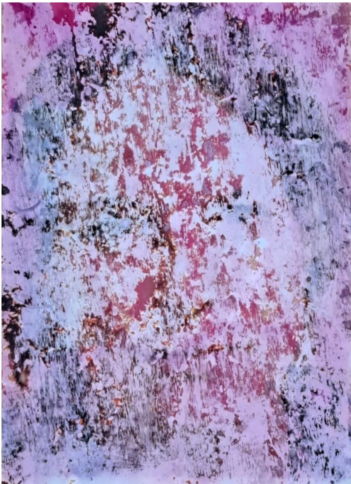
Figura 2 - Paula Cabral, série Das Unheimliche , fotografia, 2013/2024