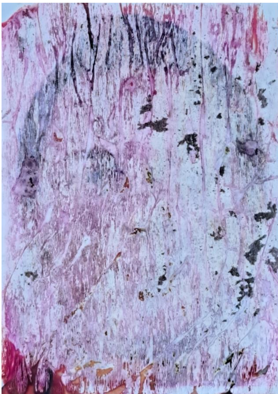
Figura 1 - Paula Cabral, série Das Unheimliche , fotografia, 2013/2024

vivido como fluxo natural da vida, impulsionador do movimento, da ação e da potência de novas formas de habitar e sentir o tempo, as pessoas, as experiências e os lugares que nos constituem e nos transformam a todo momento.