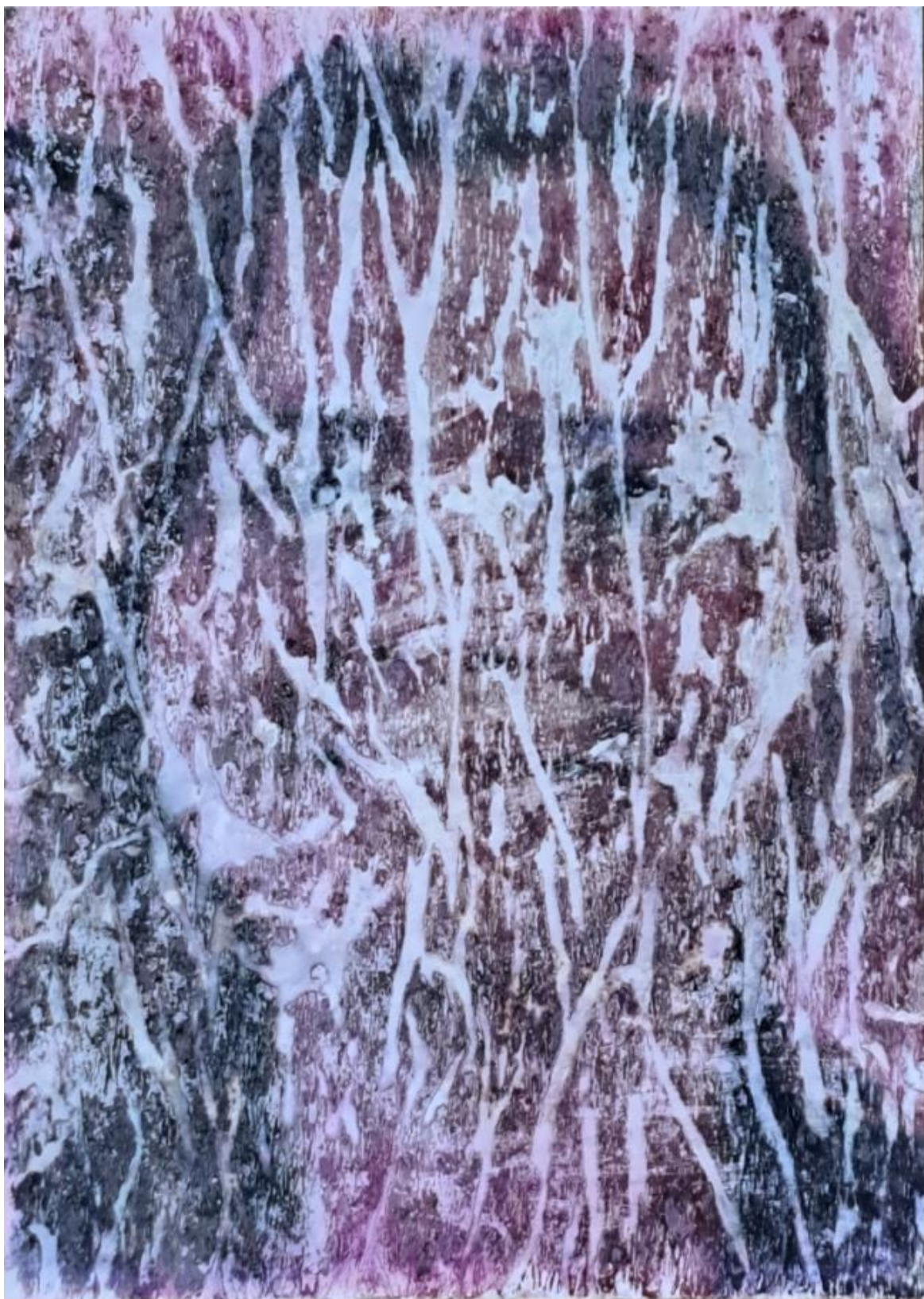
Figura 3 - Paula Cabral, série Das Unheimliche , fotografia, 2013/2024