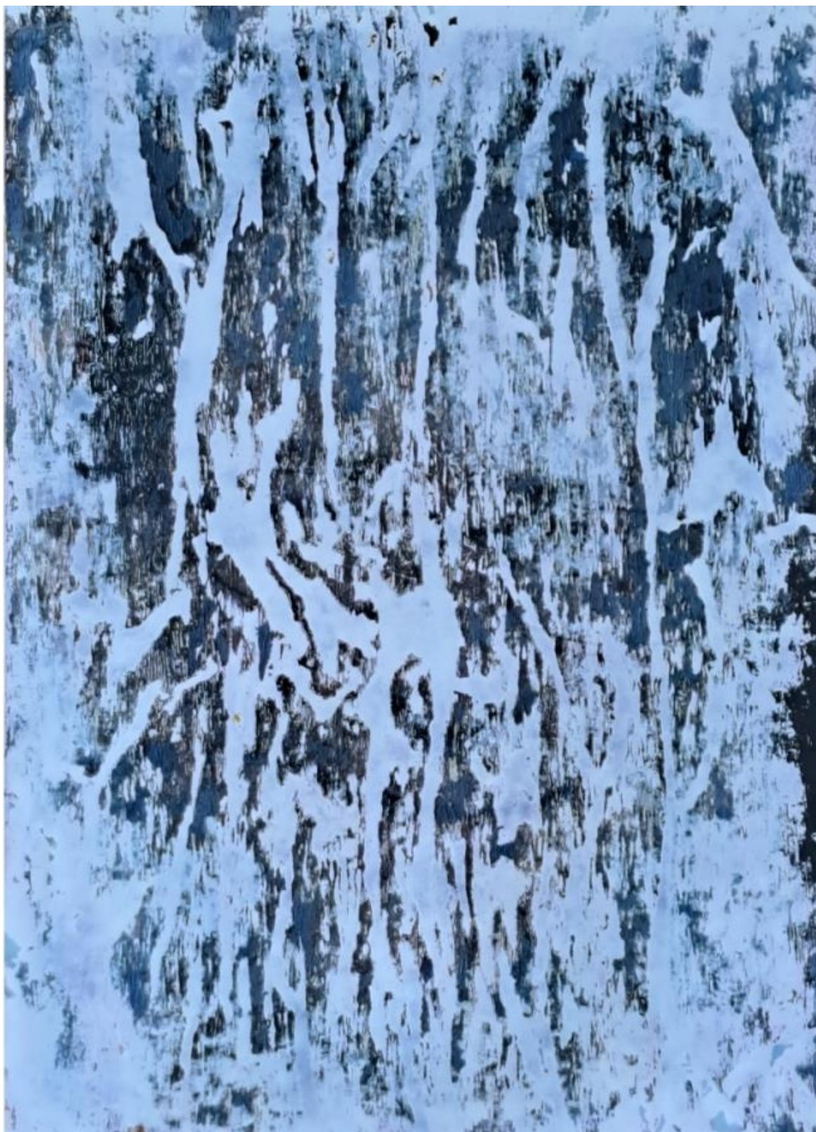
Figura 4 - Paula Cabral, série Das Unheimliche , fotografia, 2013/2024